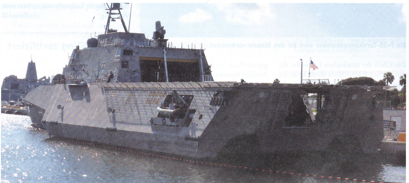
Das brandneue Littoral Combat Ship USS Montgomery (LCS 8) in Mayport. Die Katamaran Boote werden dereinst anderswo stationiert. Mayport erhält nur Einrumpf-Schiffe.

Die Anfänge der Naval Station Mayport reichen weit zurück. Bereits 1562 landete der französische Hugenotte Jean Ribault an der St. Johns River Mündung (Bucht