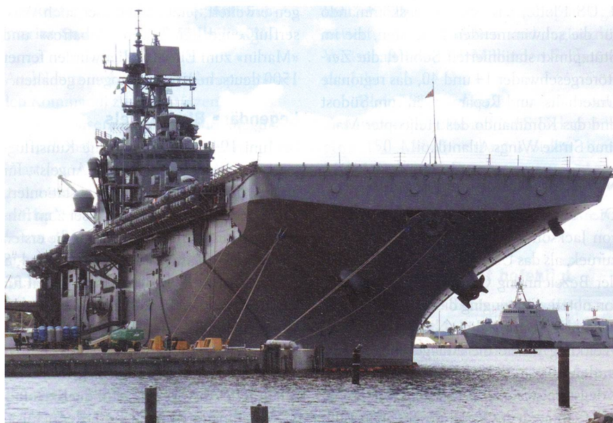
Der amphibische 42 000 Tonnen Helikopterträger USS Iwo Jima (LHD-7) ist mit seiner Kampfgruppe in Mayport stationiert. Der Träger begann anfangs 2018 eine Einsatzfahrt ins Mittelmeer und nach Nahost.