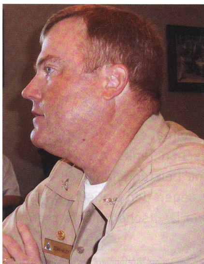
Kapitän zur See Sean Haley ist Kdt der Naval Air Station Jacksonville. Er schloss 1992 die Marineakademie ab und wurde danach Marineflieger. So flog er Helikopter in der Helicopter Anti-Submarine Squadron Light 40 (HSL-40).

Ähnlich wie andere Stützpunkte und Basen hat dieser Stützpunkt die Einsätze, die