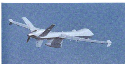
Drohnen Predator B «Sea Guardian».

Die indische Marine sieht jedoch einen Bedarf an bewaffneten Drohnen, welche entsprechende Aufgaben in der Region des indischen Ozeans durchführen. Eine mögliche Lösung könnte die in Indien ent-