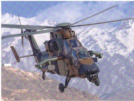
Kampfhelikopter Tiger HAD.

Frankreich lässt alle seit 2003 gelieferten Tiger HAP (Hélicoptère d'Appui et Protection) zu HAD (Hélicoptère d'Appui et Destruction) umrüsten. Die Helikopter erhalten u.a. verbesserte Triebwerke, neue Bedienelemente und das neue Sichtsystem