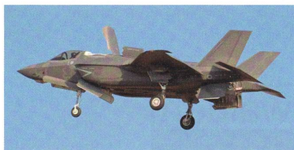
F-35B aus italienischer Fertigung.

Bei der ausgelieferten F-35B handelt es sich um das erste Flugzeug dieses Modells, das ausserhalb der Vereinigten Staaten gebaut wurde. Leonardo fertigt in enger Zusammenarbeit mit Lockheed Martin die F-35A und F-35B Kampfflugszeuge für Italien und die Niederlande; die Endmontagelinie in Cameri verfügt über eine relativ grosse Produktionskapazität, die eine Endfertigung für weitere F-35 Lightning II europäi-