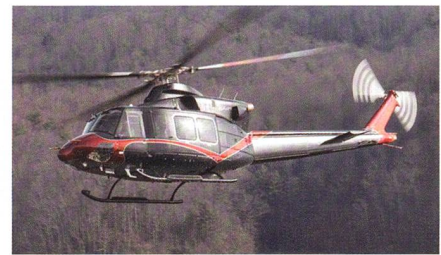
Helikopter von Bell für die Philippinen.

Mit den Helikoptern soll die philippinische Luftwaffe modernisiert werden. Sie werden für eine Vielzahl von Einsätzen wie Katastrophenhilfe, Such- und Rettungseinsätze, Personenbeförderung und Hilfs-