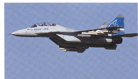
Erprobung der MiG-35 abgeschlossen.

Die Versuche wurden im Laufe des Jahres 2017 unter Beteiligung von Testpiloten des russischen Verteidigungsministeri-