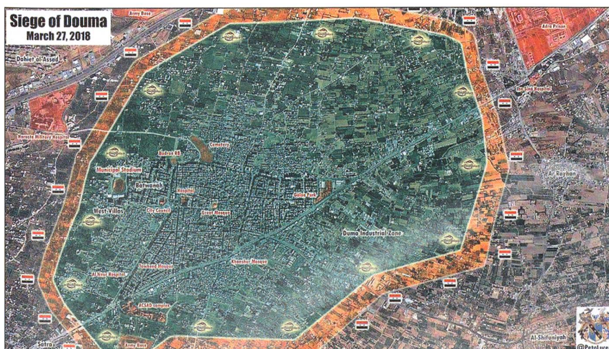
Das leicht unscharfe Satellitenbild zeigt die Einkesselung von Ost-Ghouta (grün).