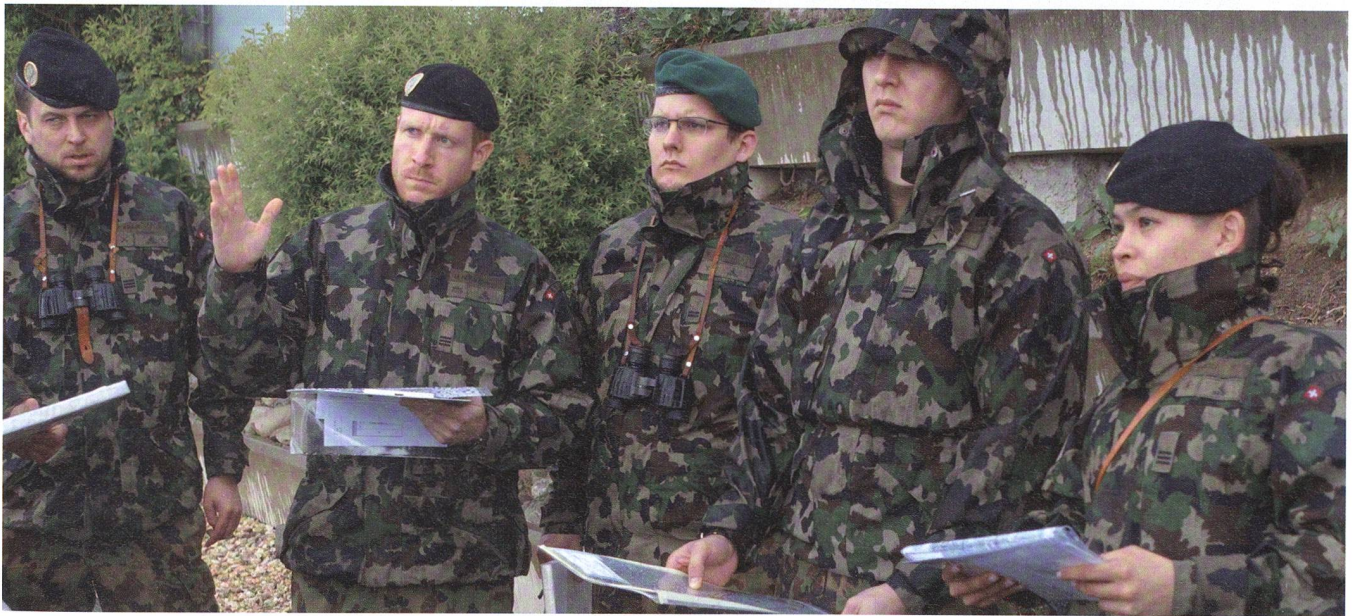
Lagebeurteilung in der Ebene von Zwillikon, einer Ortschaft der Gemeinde Affoltern am Albis, im Zürcher Säuliamt.