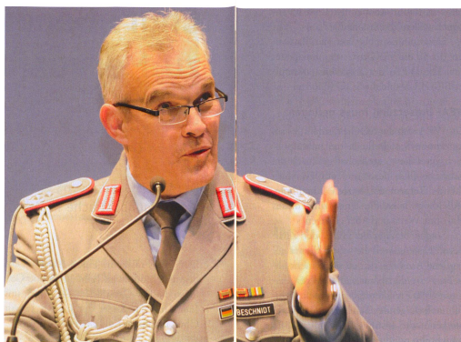
An einem Referat 2018 bei der OG Graubünden in Chur.

Ich sehe mich als «Mittler» zwischen den bilateralen Interessen, welche die Grundlage der kooperativen Zusammenarbeit zwischen dem Bundesministerium