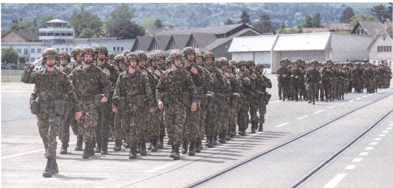
Einmarsch des Bataillons in Dübendorf.