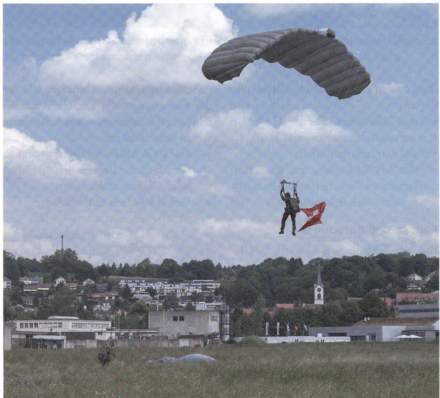
Fallschirmaufklärer landet mit der Schweizerfahne.