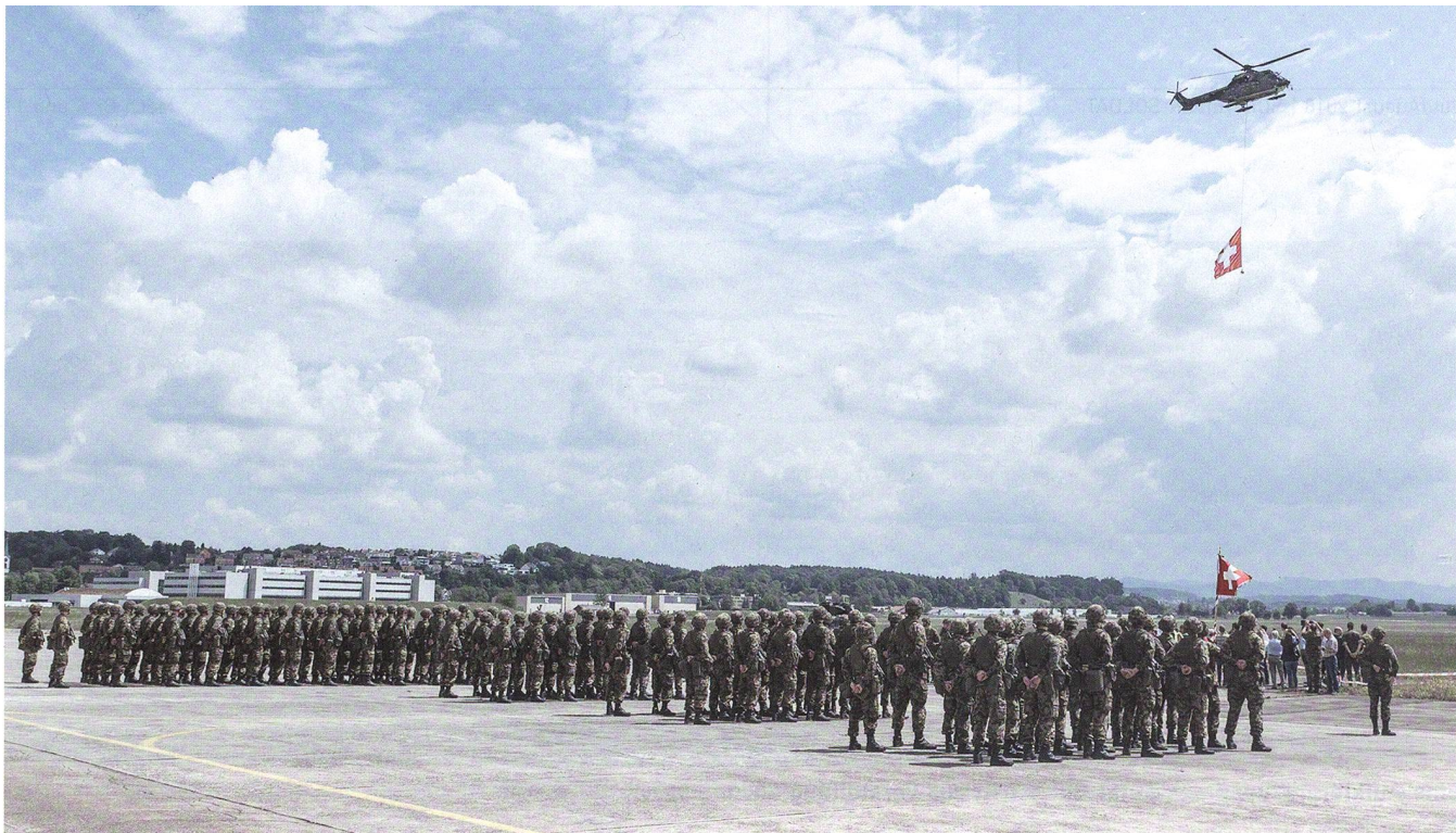
Hoch über dem Bataillon mit dessen Standarte zieht ein Super Puma mit der Schweizerfahne seine Bahn.