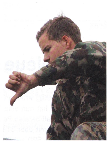
Handzeichen zum Richter! Der Richter justiert, bis der Leo marschbereit ist.

sind für Details verantwortlich, die über Sieg oder Niederlage, über Leben und Tod entscheiden können.