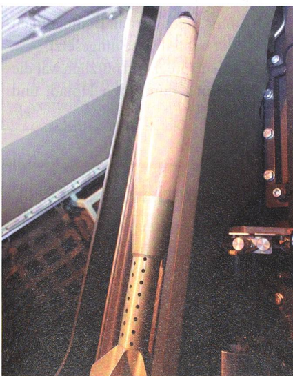
Vereinfachte Bedienung: Die Mörsergranaten werden automatisch geladen.