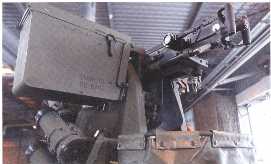
Die Waffenstation für den Nahbereich: Der Mörser-Kdt bedient das 12,7-mm-MG mit angebauten Nebelwerfern. Er setzt die Waffenstation ferngesteuert ein.