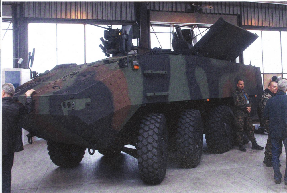
Unser Fotograf Major Kevin Guerrero nahm den Mörser 16 in Frauenfeld auf.

Bis 2009 unterstützte der 12-cm-Minenwerferpanzer 64/91 die Kampfverbände der Infanterie, Panzergrenadiere und Panzer. Dann entstand eine empfindliche Lücke. Mit dem Rüstungsprogramm 2016 beschlossen die Räte, es seien 32 RUAG-Mörser COBRA zu kaufen. Die Beschaffung geht zeitgerecht voran. Im September präsentiert die Mowag, die dem System den Piranha IV stellt, in Bürglen den neuen Panzer mit dem 12-cm-Rohr der SOGART, den Schweizer Artillerieoffizieren.