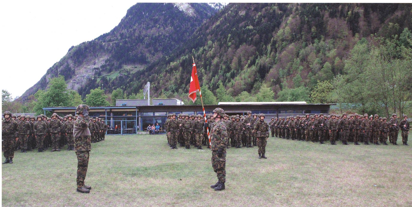
Bilder: HQ Bat 11