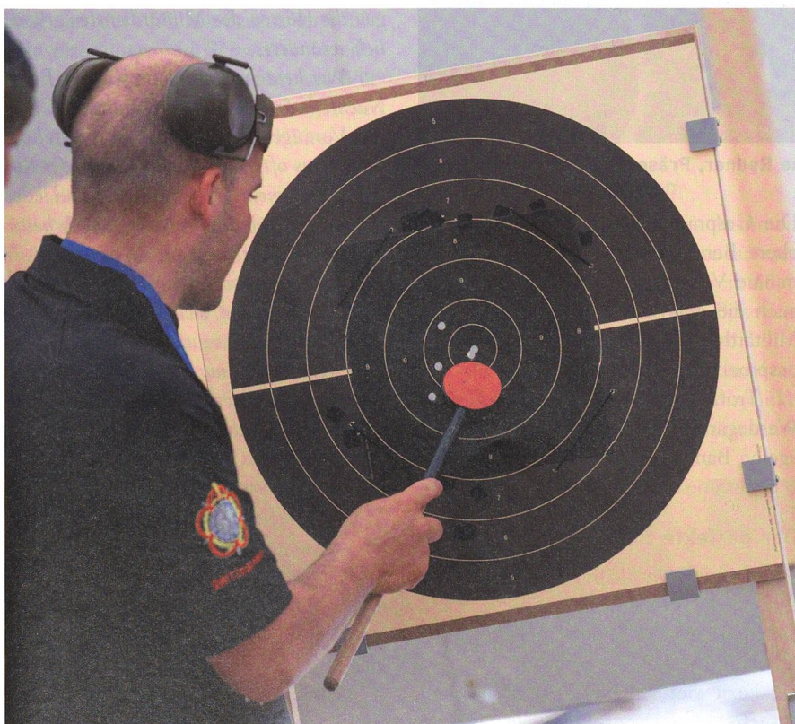
Das freut das Schützenherz.