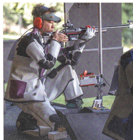
2019 findet die CISM-WM in China statt.