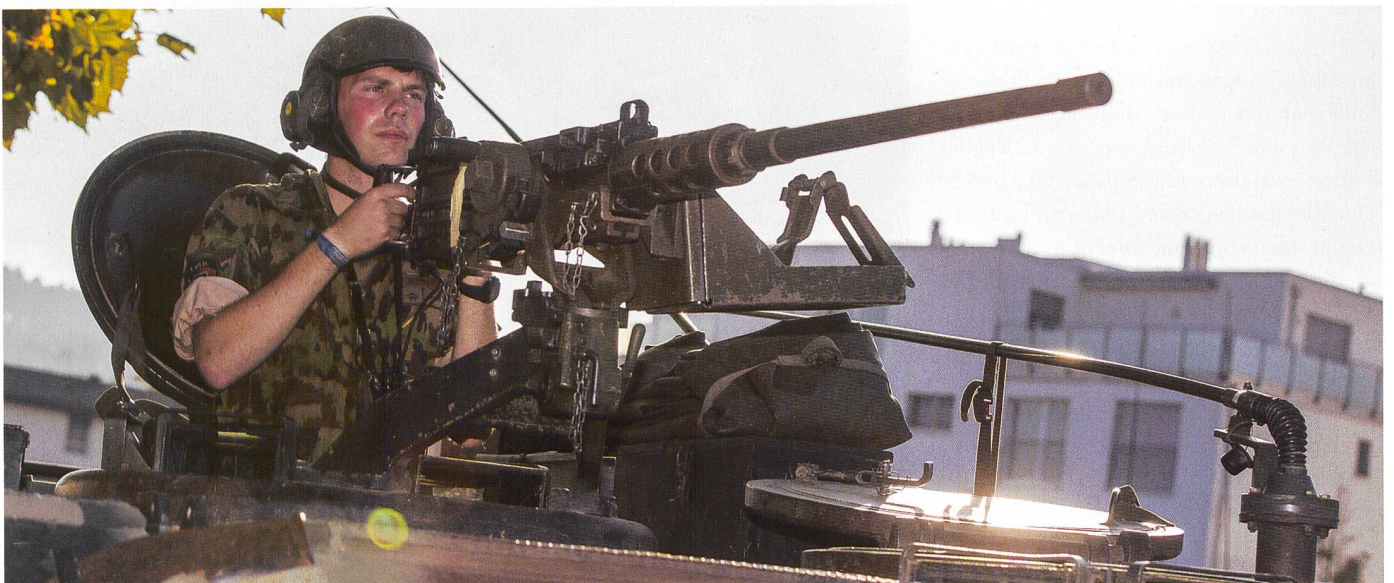
Silbergraue im Schuss: Bereit zum Einsatz in der grossen Übung «COMPOSITO» des Lehrverbandes FU.