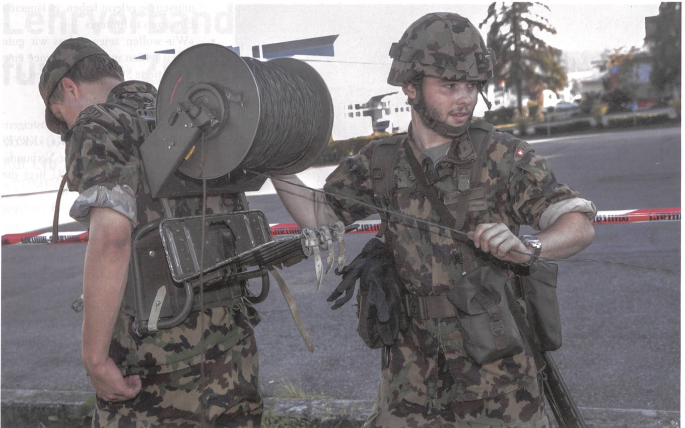
Ein traditionelles Bild vom Engagement unserer Silbergrauen. Kameraden im Einsatz.