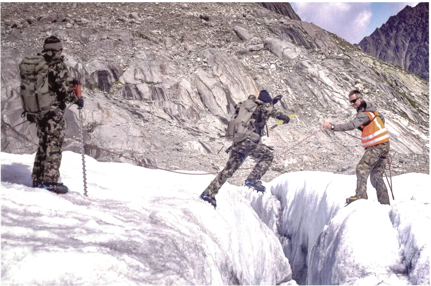
Bilder: ABC Abwehr Labor 1