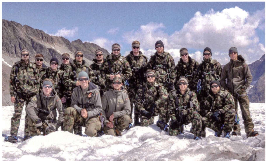
Das komplette Detachement «GAULI».