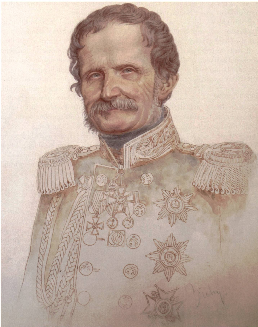
Baron Antoine-Henri Jomini. Seines 150. Todestages wurde gedacht.