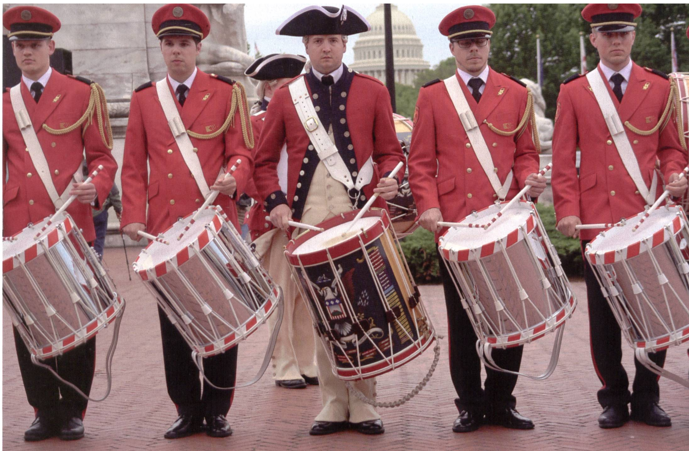
Das verstärkte Swiss Army Drum Corps hinterliess in den USA bleibenden Eindruck.

Referat auf den Einfluss Jominis innerhalb der amerikanischen Streitkräfte bis in die heutige Zeit: «Jomini's concepts of maneuvering the mass of a force to control a decisive point while disrupting lines of communication is just as relevant today.»