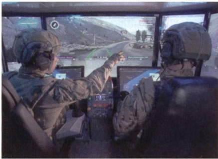
Israels Panzerprojekt «CARMEL» sieht nur zwei Mann Besatzung vor. Experten äussern aus Westsicht Zweifel.

1. Instandsetzung: Beim Leopard 2 kann die Besatzung mehr oder weniger autonom relativ umfangreiche Instandsetzungen durchführen (so Spann- und LaufRadwechsel, Raupenwechsel, usw.), sofern