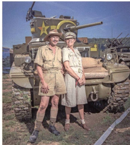
Trugbild: Sieht so der Wüstenkrieg aus?

Eines vorweg: Militärischen Oldtimer-Freunden ist ihre Leidenschaft für alte Panzer und Uniformen zu gönnen. Auch Oldtimer-Organisatoren verdienen Erfolg und Freude. Ins Auge stach am 11. August