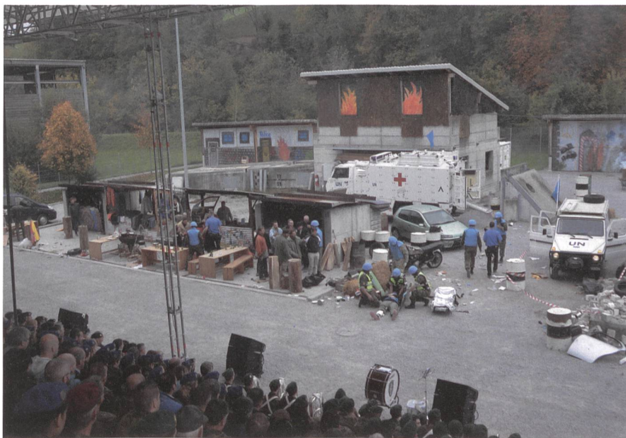
In Stans wurden eindrückliche Einsatzszenarien gezeigt.

ten Rede übergab sie Oberst i Gst Keller zur Erinnerung an den Kanton Nidwalden einen handgrossen Stein vom Stanserhorn.