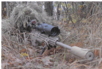
Scharfschützengewehr SSG M1.

Das österreichische Bundesheer hat sein neues mittleres Scharfschützengewehr Steyr Mannlicher SSG M1 offiziell übernommen. Das Steyr Mannlicher SSG M1 für das Bundesheer verschießt das Kaliber .338 Lapua Magnum (8,6 × 70 mm). Der Repetierer mit Zylinderschluss bietet