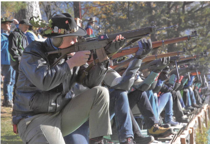
Rütli 2018 – Feuer frei: 48 Schützen legen an.

Im ewigen Duell Bern gegen Aarau bei den Gastsektionen geht es zügig. Nach Ablauf der Zeit erfolgt ein Hornstoss, rotberockte Zeiger wirbeln heran, schwingen