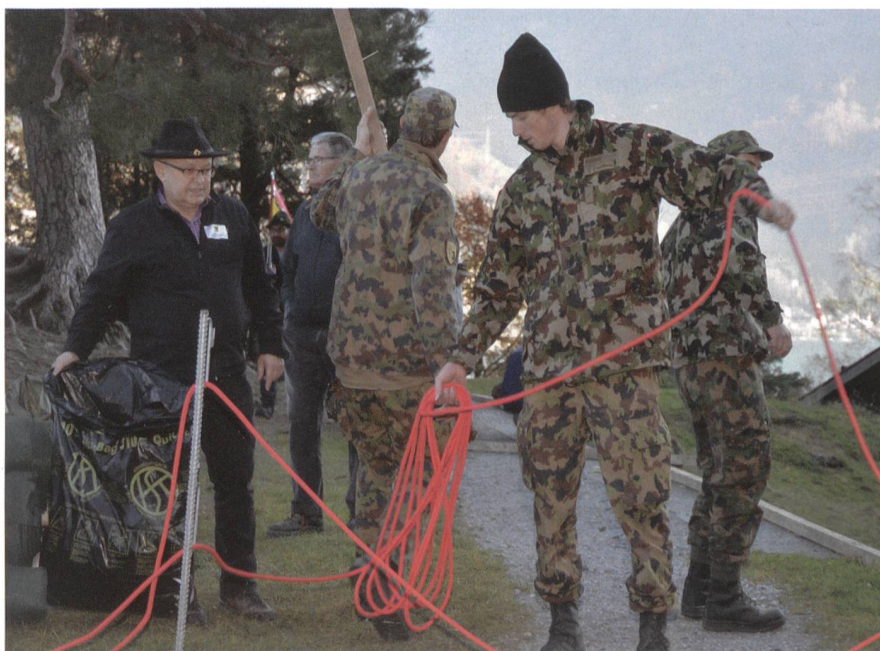
Wird auf dem Rütli sehr geschätzt: der Einsatz der Armee.

Was heute noch frei ist, wäre dann – allerhöchstens – noch geduldet. Wollen wir das? James Kramer