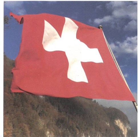
Noch weht die Schweizerfahne.