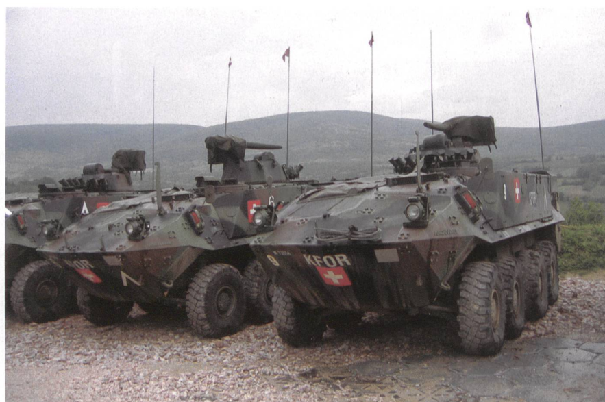
Aus der Frühzeit des Schweizer KFOR-Einsatzes: Piranha-2 der SWISSCOY.