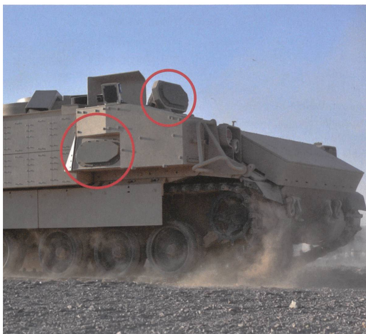
Trophy-System vorne seitwärts gut erkennbar am Bradley.