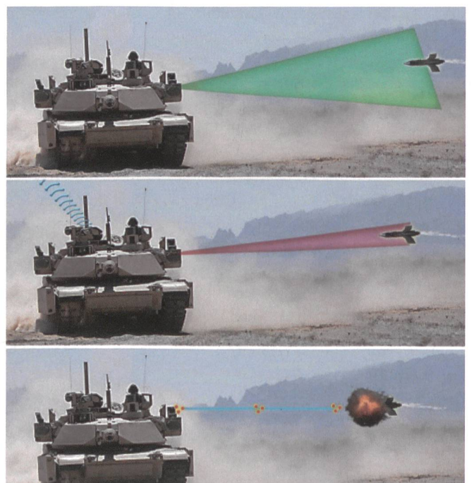
Geschoss entdecken, erfassen und sofort zerstören.