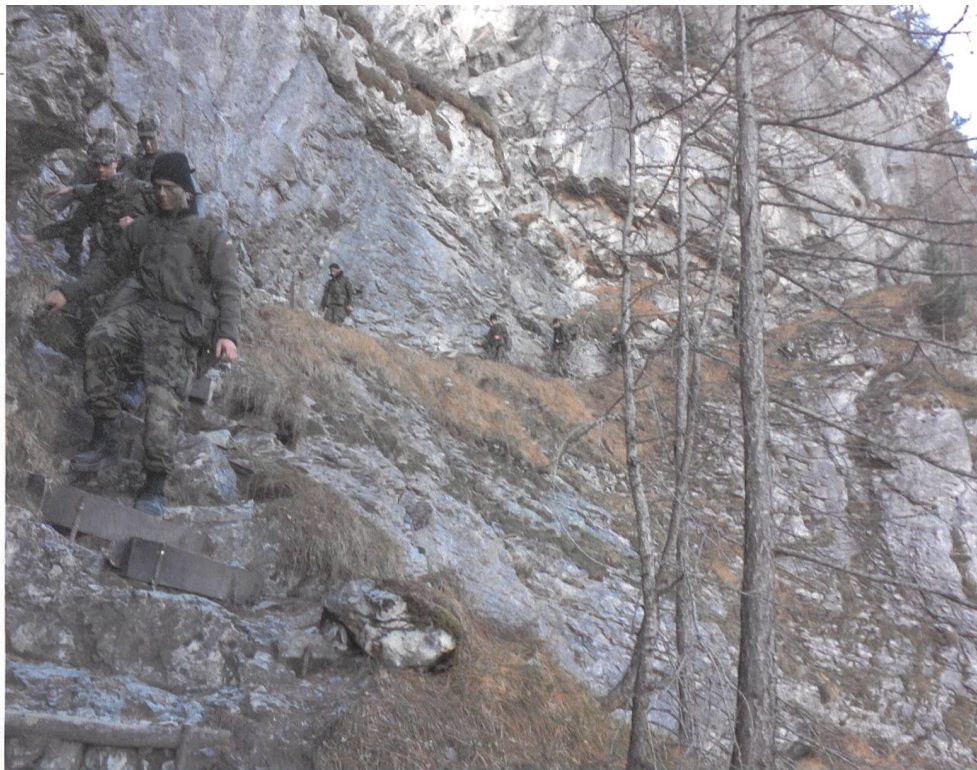
Phase «CROSS»: Die Route führt über den 2314 Meter hohen Gemmpass vom Wallis ins Berner Oberland. Hier der Abstieg vom Pass ins Gasterental.