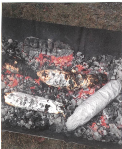
Phase «CATCH»: Forelle in der Glut, gelernt im Kurs «Leben im Felde».

«CATCH» unterliegt Übungsbestimmungen. Die gefangenen Fische werden vor dem Ausnehmen gewogen und durch den Fourier per Kilogramm abgerechnet. Die Fischzucht stellt Brennholz bereit. Fängt einer eine Forelle, die mehr als anderthalb Kilo wiegt, dann wird diese aufgeteilt und kein zusätzlicher Fisch gefangen - versteht sich.