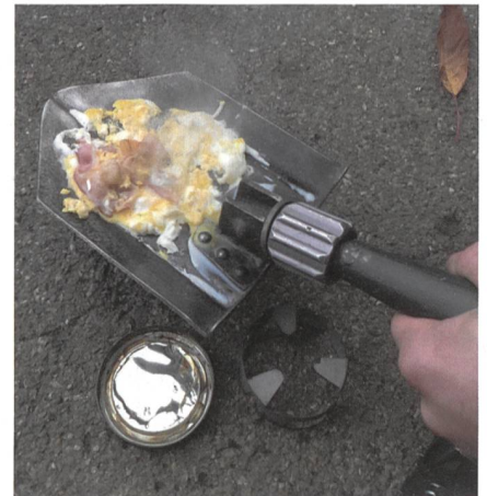
Im Stern-OL zusammengetragen: Frühstück mit Ei und Bratspeck auf Spaten.

Um 00.15 Uhr sperren die SBB den Tunnel durch den Unteren Hauenstein. Major i Gst Fetz zieht die Protokontrolle durch: Leuchtgamaschen, Marschstrecke auf drei Karten 1:50'000, Feldflaschen gefüllt, Notfallzettel, keine langen Gegen-