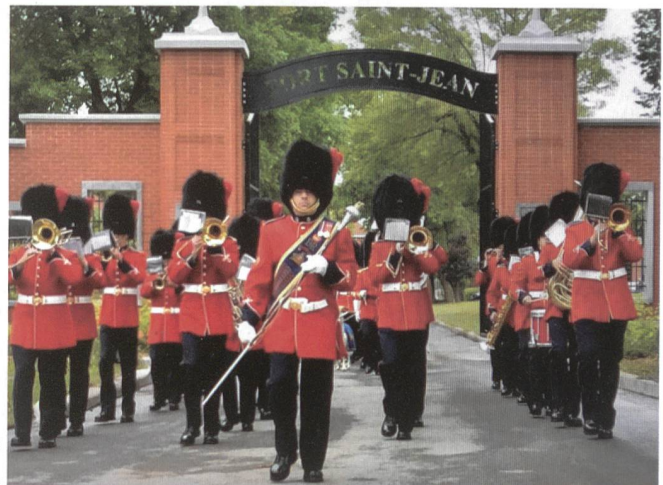
Traditionspflege am Fort Saint-Jean.

Die grösste Erkenntnis war jedoch, dass die Schweizer Armee gut ausgebildet ist und wir uns nicht scheuen müssen, uns mit selbst sehr guten Ausbildungsmodellen anderer Armeen zu messen. +