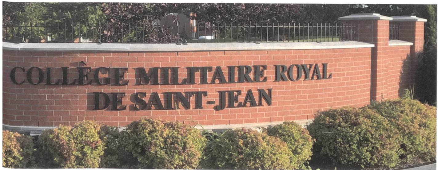
Das Royal Military College in Saint-Jean, Kanada.

genommen. Die Amts- und Kurssprache ist jedoch Englisch.