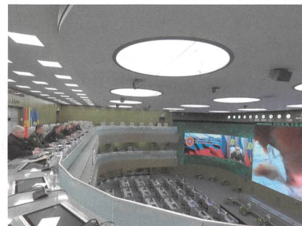
26. Dez. 2018: Putin erteilt Startbefehl, mit Generälen Shoigu und Gerassimow.