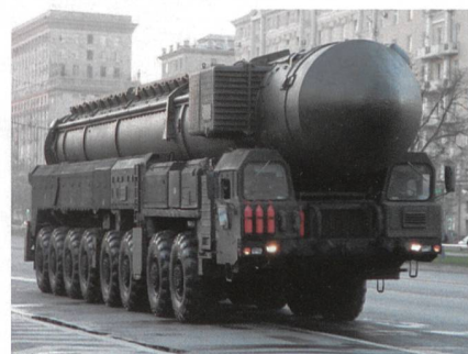
Raketensystem in der Stadt Moskau.