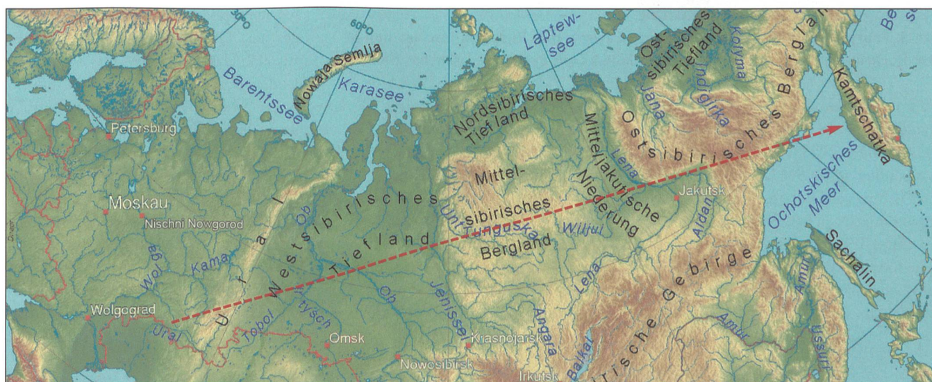
Die Avangard-Flugbahn führte über 6000 Kilometer von Orenburg an der kasachischen Grenze nach Kamtschatka am Pazifik.