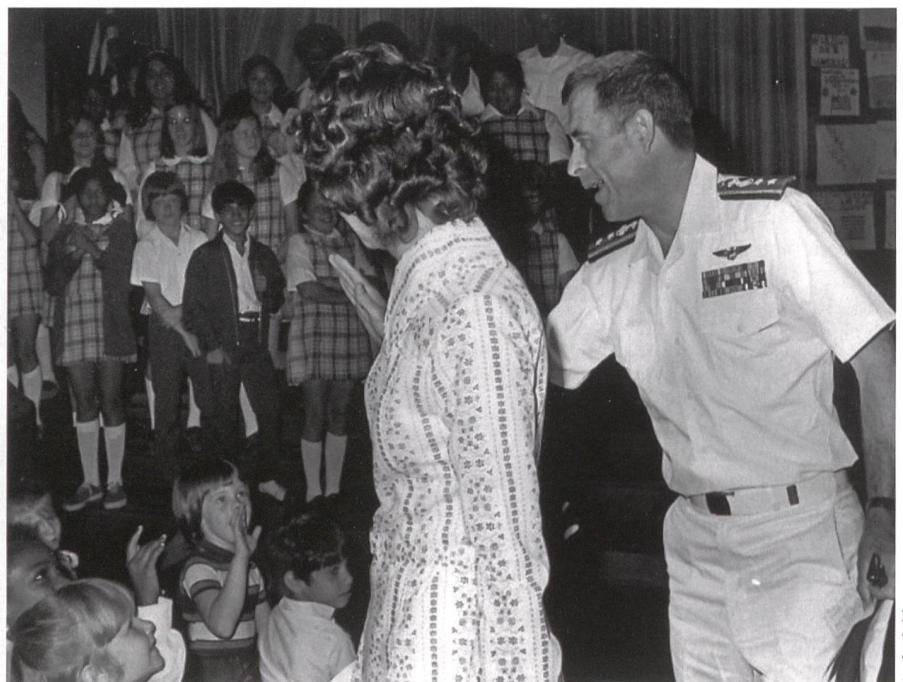
Zum Konteradmiral befördert, besucht Denton mit seiner Frau Mobile, Alabama.