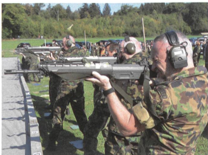
Schiessen und Armee – untrennbar!

Das heutige Schengen-Abkommen entspricht in der Auslegung und punkto Kosten schon lange nicht mehr dem damals zugestimmten Abkommen, denn trotz der abgegebenen Zusage, es werde