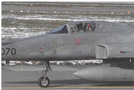
Kooperation mit USA seit 1976: F-5.

Die Weiterentwicklung von zivil und militärisch nutzbaren Technologien wird sich stark auf die Leistungsfähigkeit und