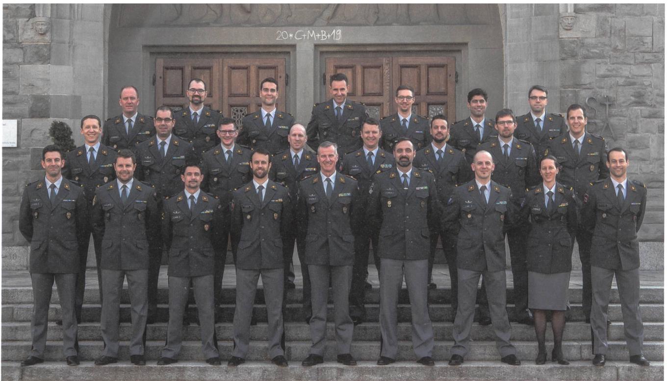
Gruppenbild vor der Pauluskirche in Luzern, wo traditionell die Generalstabsoffiziere brevetiert werden.