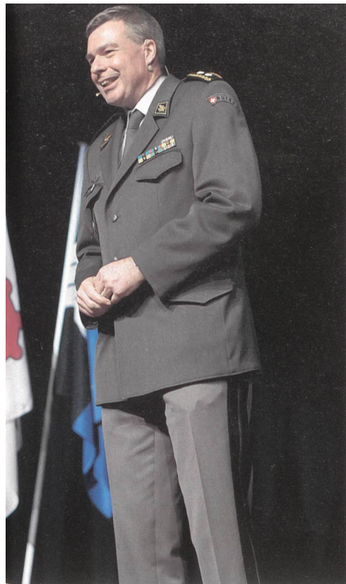
Die Säule der Armee, und Div Walser.

Die Armee habe 2018 184 526 Diensttage geleistet. Dazu zählte die Unterstützung ziviler Behörden. «Diese wären ohne die Armee nicht zu bewältigen». So das WEF, die Lauberhorn-Rennen, eidgenössische Turn- Schwing-, Schützenfeste und das Basel Tattoo. Der C Kdo Op fügte an, dass man über die Truppen in dieser Zeit nicht verfügen könne, und deshalb käme die Kernkompetenz der Armee zu kurz.