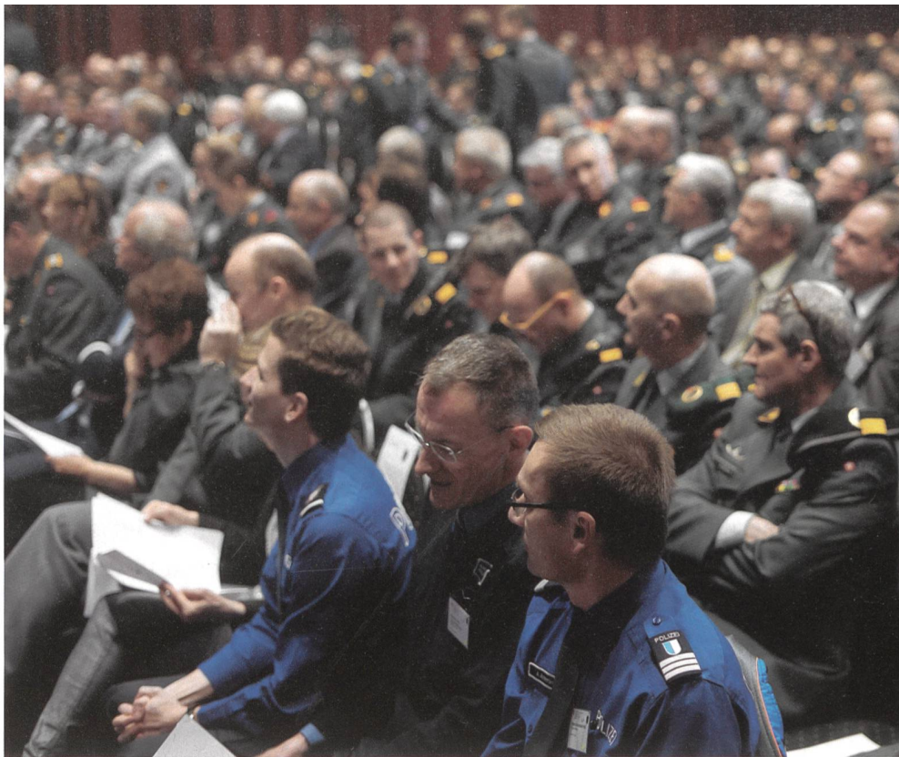
Volles Haus im «Le Théâtre» Emmenbücke, vorne Offiziere der Luzerner Polizei.