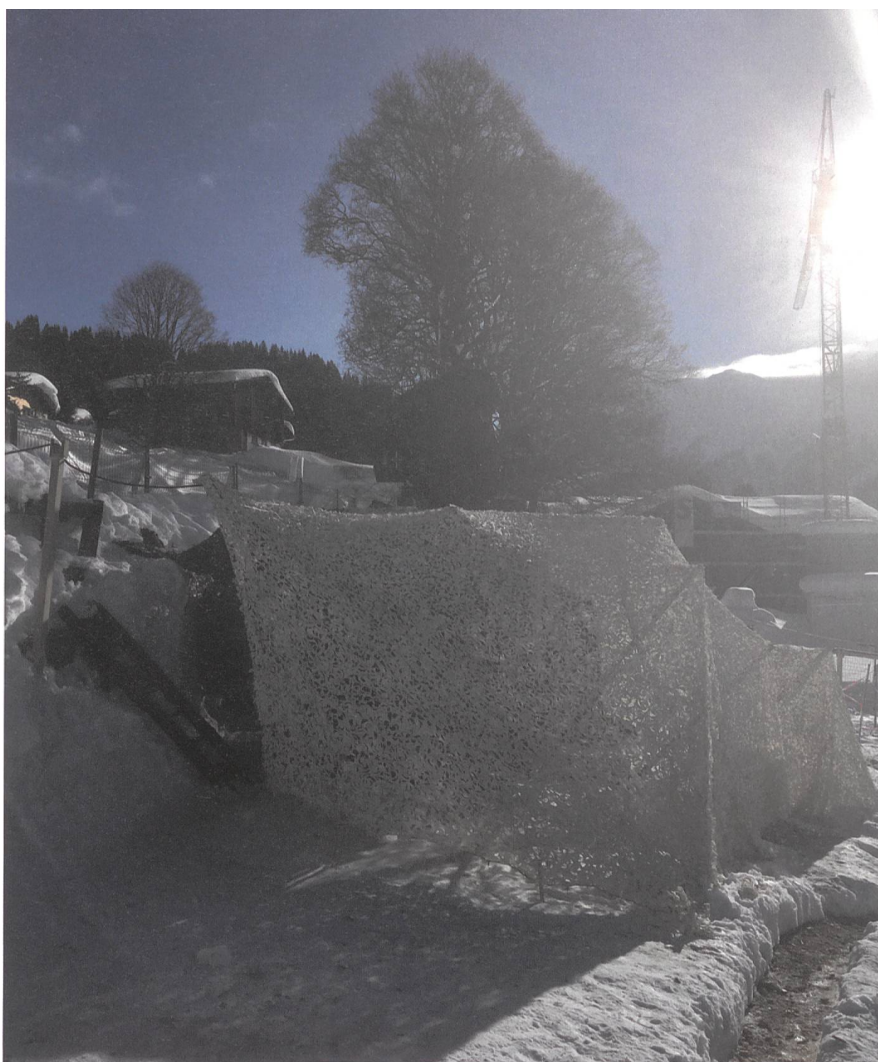
Das Feuerleitgerät 95/12: Unser Auge in den Himmel.