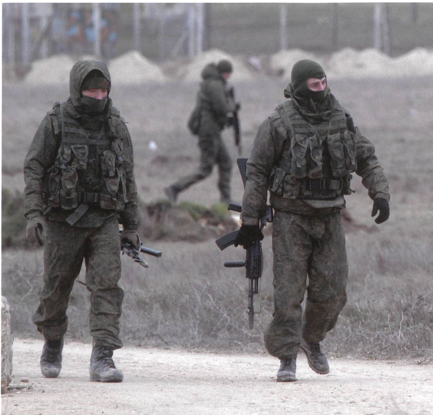
2014: Besetzung der Krim. Die «kleinen grünen Männchen» waren Elitetruppen.

Wenn man auf einer Weltkarte Autokratien und Demokratien auf der Zeitachse der letzten 50 Jahre farblich kennzeichnen würde, würde man den Vormarsch der Autokratien deutlich erkennen. Allerdings gibt es unter den 50 gescheiterten Staaten viele Autokratien, die zu den Verlierern zählen. «Erfolgreiche» Autokratien weisen ge-