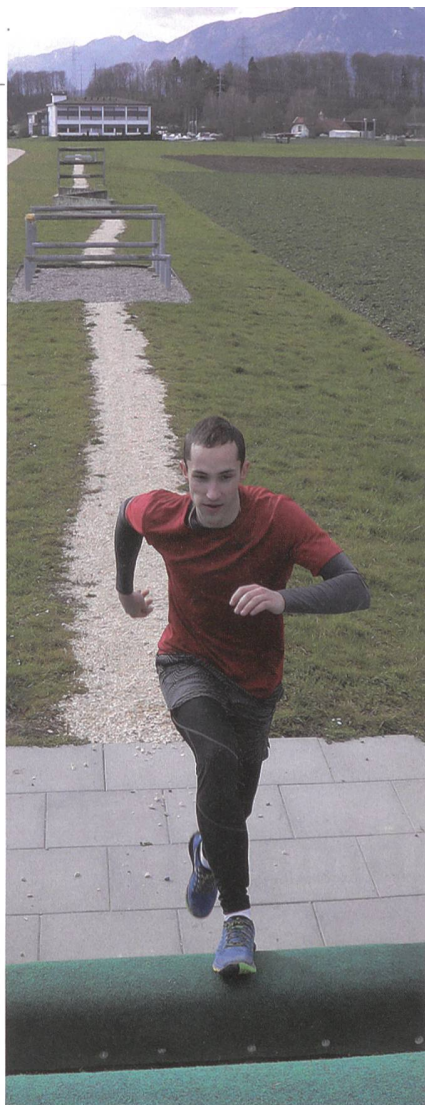
Auf der Hindernisbahn zeigt, sich wer sowohl physisch als auch mental fit für den Dienst ist.

Die gute Nachricht: Im Verlauf der RS wird es signifikant einfacher. Die Studien halten schwarz auf weiss fest: Wer mehr Sport macht, hat ein geringeres Verletzungsrisiko und höhere Motivation in der