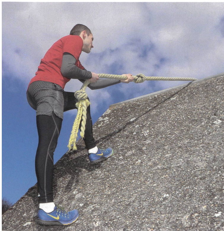
Dranbleiben! Auch die mentale Vorbereitung wird gefördert.

Mit der Sport-App könne man sich jedoch gezielt auf das nötige Fitnesslevel vorbereiten. Andere Faktoren wie die psychische Verfassung sowie die nötigen Si-