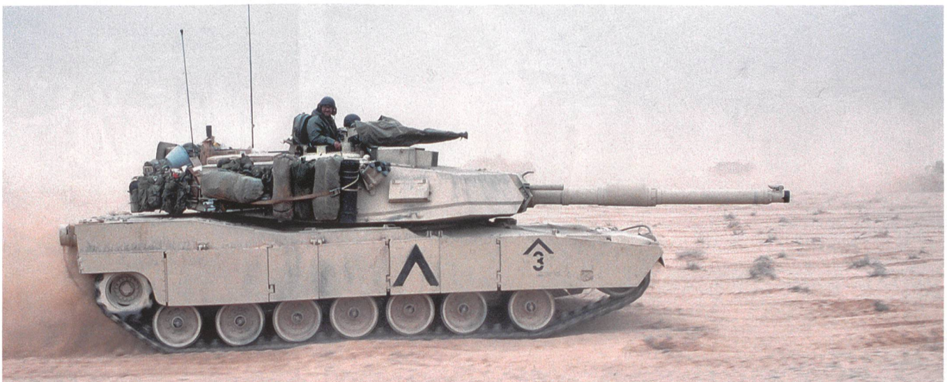
Panzer M1A1 Abrams, VII. Korps, 1. Panzerdivision, Vormarsch Richtung Madinah Ridge.