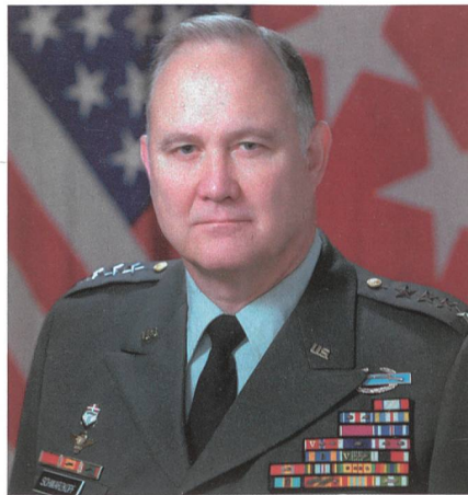
General Norman H. Schwarzkopf (1934–2012).

Die zweite Linie verteidigten die restlichen Garde Div. Darauf entbrannte die grösste Panzerschlacht von «DESERT STORM», die Schlacht um die Medina-Brücke, einen Flussübergang an der irakisch-kuwaitischen Grenze. Nach zwei Stunden erbittertem Panzergefecht waren grosse Teile der Garde Div zerschlagen und die restlichen in den Bereitstellungsraum Basra zurückgeworfen.