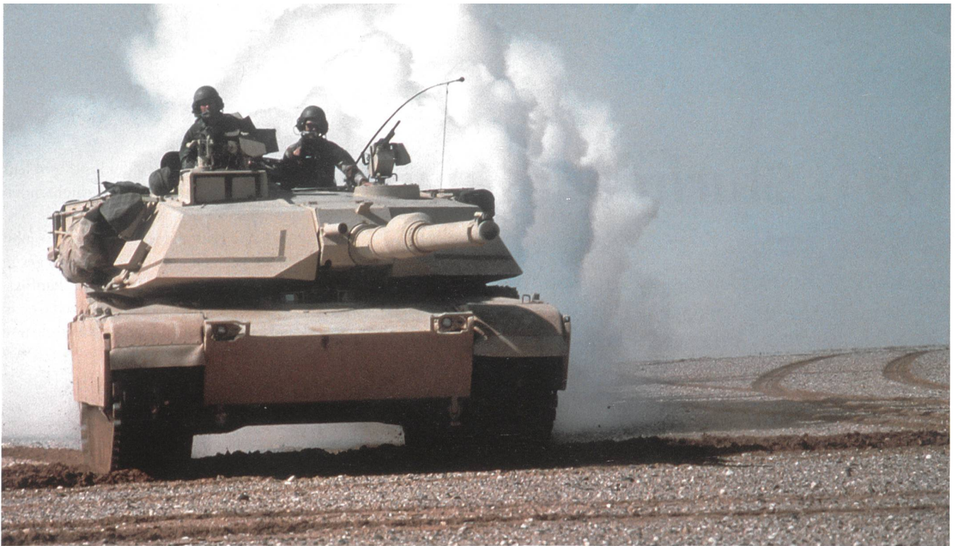
Panzer M1A1 Abrams, VII Korps, 3. Panzerdivision, Vormarsch Richtung Al Bucayyah.

Kuwait selber oder verteidigte die irakische Grenze zu Saudi-Arabien.