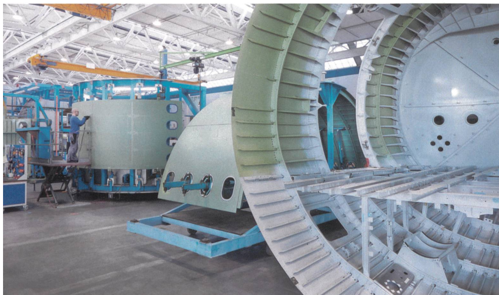
RUAG Structures Oberpfaffenhofen.

Für 2019 geht die RUAG davon aus, dass die Weiterentwicklung stabil positiv bleiben wird. Wachstum erwartet der Konzern im Flugzeugstrukturbau und im Munitionsgeschäft mit Armeen und Behörden. Allerdings wird der Reingewinn wegen der Kosten für die vom Bundesrat beschlos-