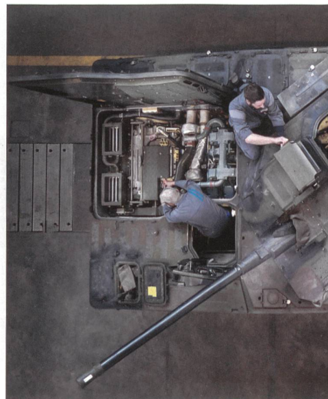
RUAG Thun Unterhalt.