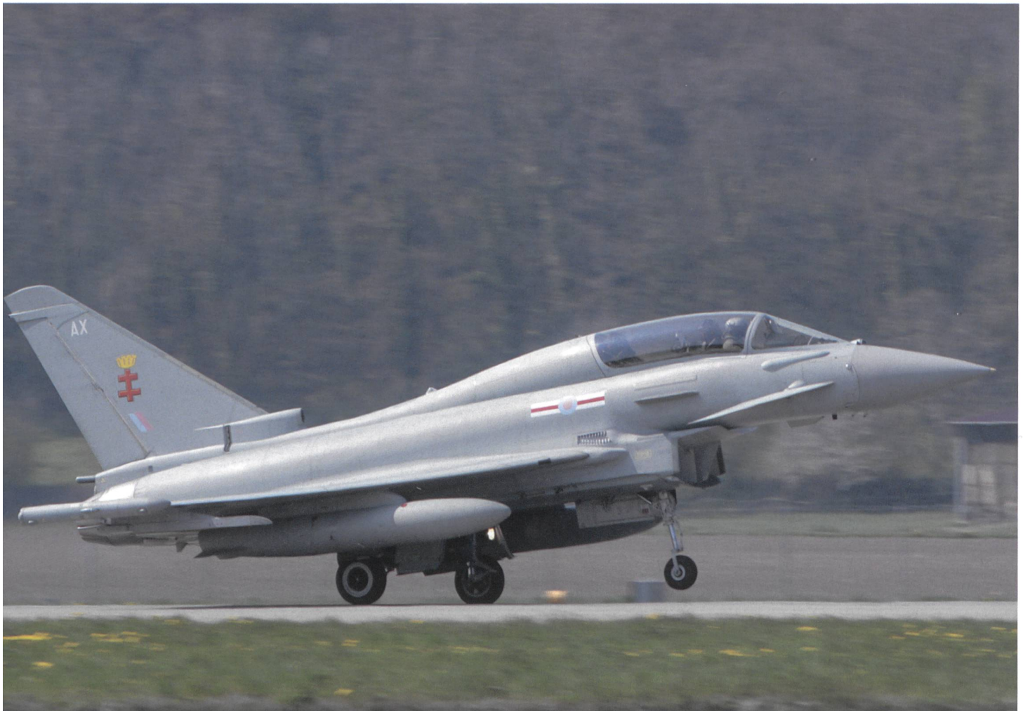
Start des britischen Eurofighters.

Er dankte der Schweiz für die Möglichkeit, den Eurofighter testen zu lassen,