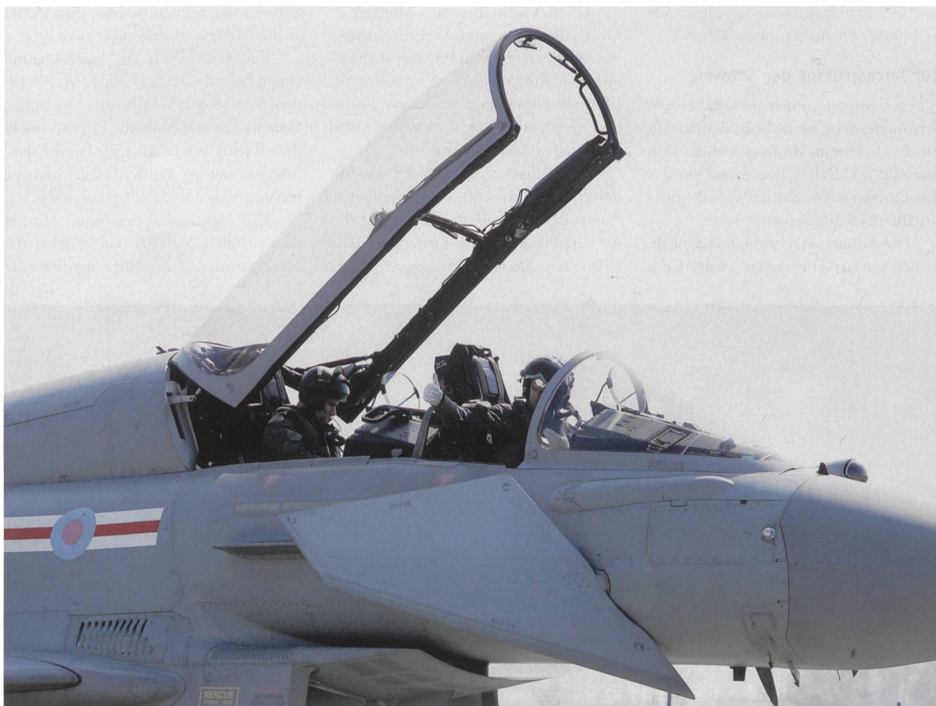
Zwei Eurofighter-Flieger nach der Landung.