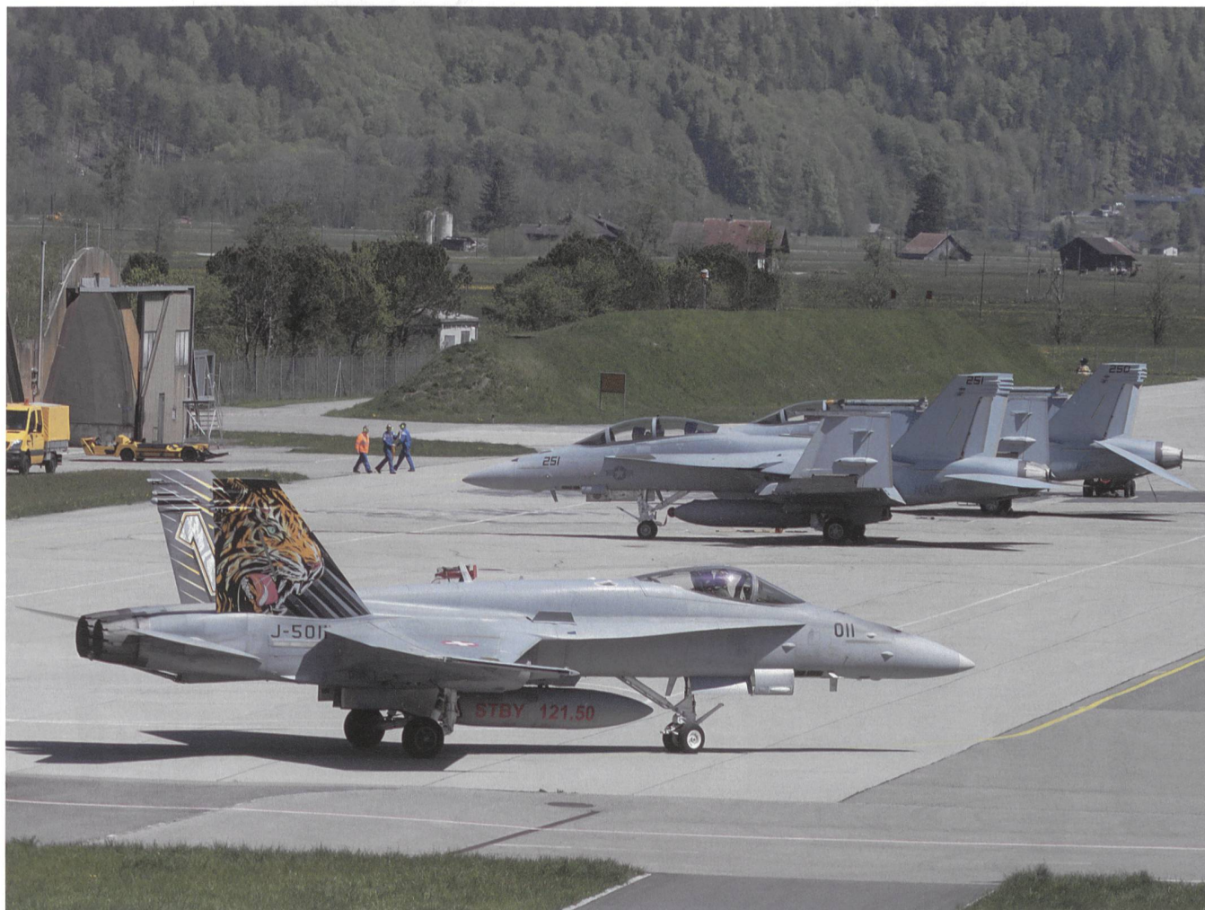
Meiringen: Vorne die Staffelmachine 11, hinten die beiden F/A-18 Super Hornet.