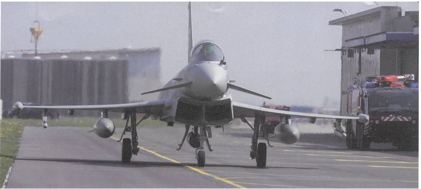
Der Eurofighter Typhoon rollt zum Start.

und unterstrich, dass die Bundesregierung an der Zusammenarbeit mit der Schweiz interessiert sei. Die EU brauche die Schweiz als sicherer Hort in Europa, weil sich die Sicherheitslage in den letzten Jahren stark verschlechtert habe.