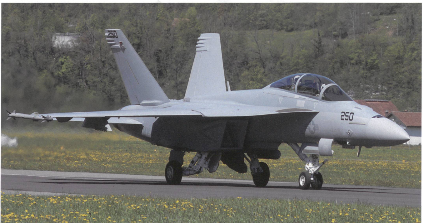
Der F/A-18 Super Hornet in Meiringen.

Die Maschinen des Super Hornet dienten der U.S. Navy und bildeten das Rückgrat der Trägerflugzeugflotte der