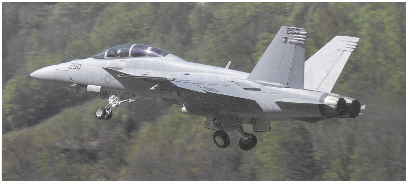
Gut erkennbar das Doppeltriebwerk am Super Hornet.

USA. Sie seien hochleistungsfähig, bezahlbar und verfügbar. Der Super Hornet ist ferner in der Royal Australian Air Force und der Kuwait Royal Air Force im erfolgreichen Einsatz. Über 700 Stück sind ausgeliefert.