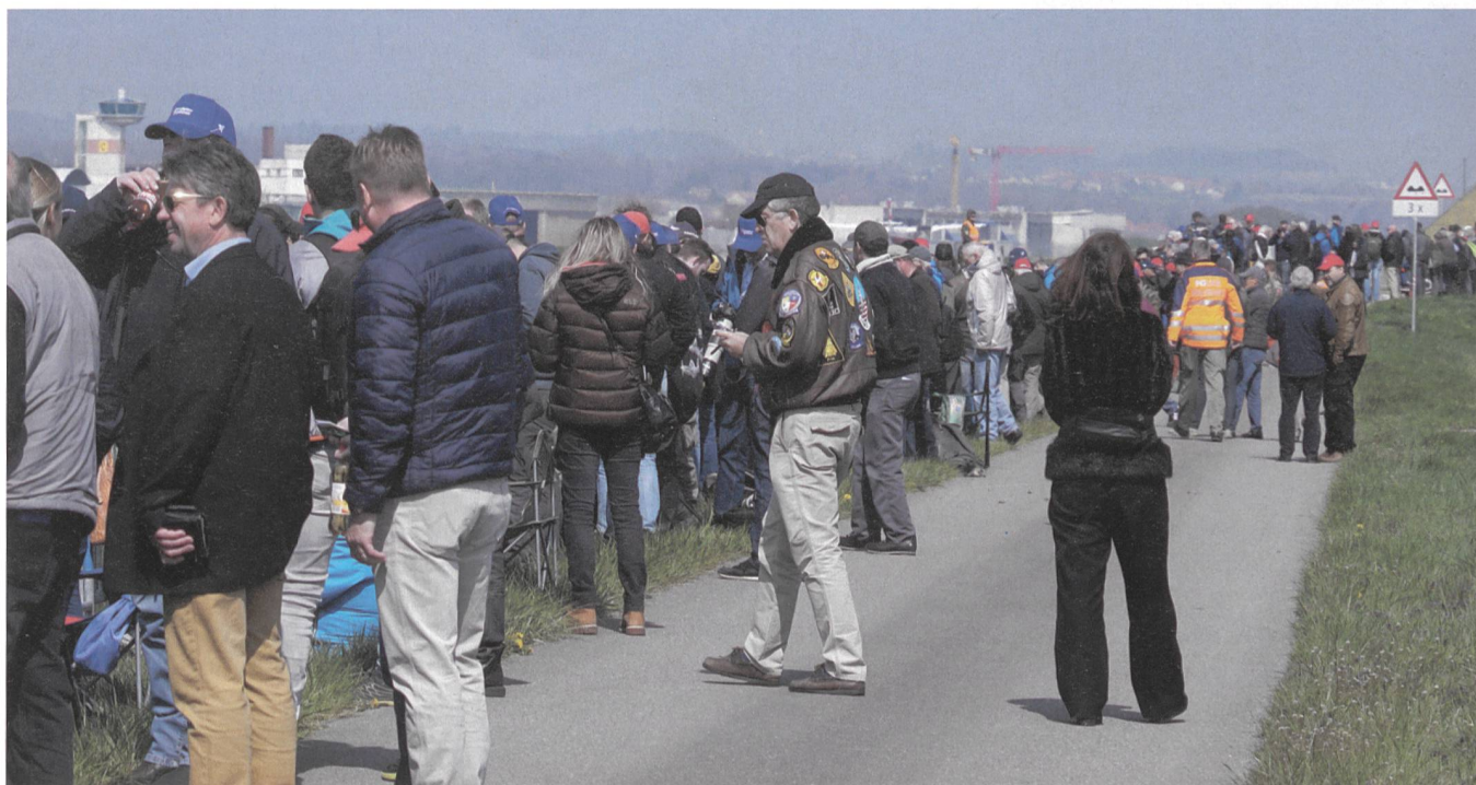
Hunderte Spotter beobachten in Payerne den Eurofighter.