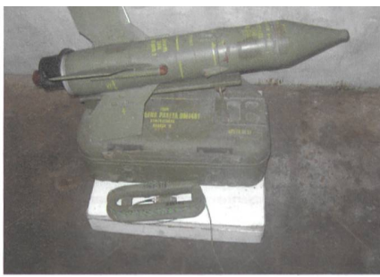
9M14 Maljutka = NATO: AT-3 Sagger.