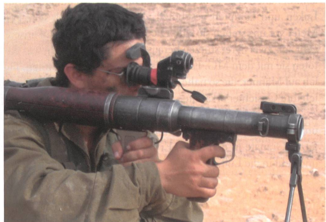
Israelischer Soldat zeigt an der Golanfront erbeutete RPG-7.