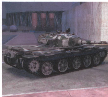
Die Israeli rüsteten das Panzerkorps mit Beutepanzern aus: der T-62, den sie Tiran-6 nannten (Tiran-1 = T-54).