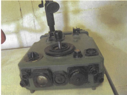
Der Steuerhebel der Sagger-Rakete.