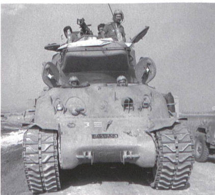
Super-Sherman. Israel ersetzte die 75-mm-CN-Geschütze durch eine französische 105-mm-Kanone Typ D-1508 L/51.

Er verband die Kampfkraft des Tanks mit der Idee, der Merkawa führe im Heck acht Panzergrenadiere mit: die direkte Konsequenz der brutalen Verluste. ✠