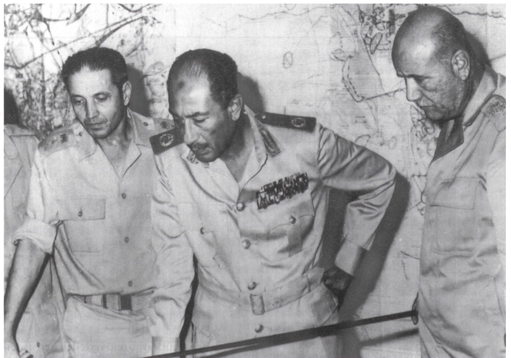
Im HQ 10: General Shazli, Präsident Sadat und Verteidigungsminister Ismail.

Die israelischen Panzerkommandanten mussten ihr Gefechtsverhalten sofort umstellen, sollte ihre Truppe überleben. Die neue Botschaft lautete: