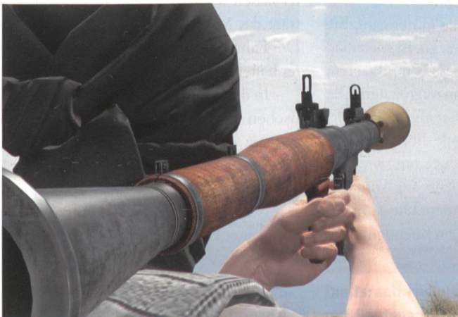
RPG-7: Abschussvorrichtung, optisches Visier und Granate.