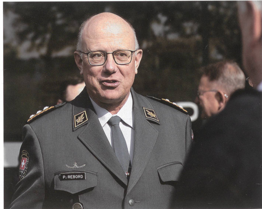
KKdt Phillipe Rebord, Chef der Armee.