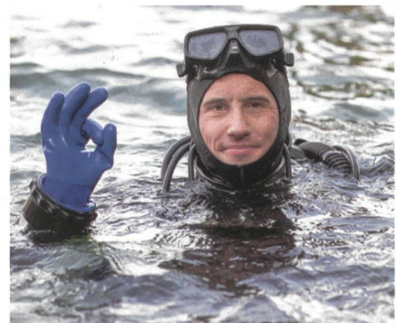
Militärtaucher im schweren Einsatz.