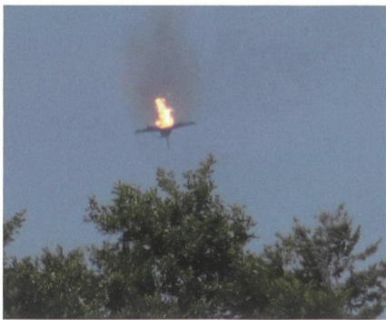
24. Juni 2019, um 14 Uhr: Jet-Absturz über Mecklenburg-Vorpommern.

Eines der beiden Flugzeuge war in Schwerin nahe der Ortschaft Jabel in ein Waldstück abgestürzt. Das andere sei südlich der Ortschaft Nossentiner Hütte an ei-