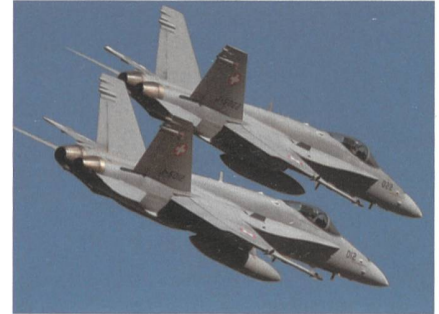
Zwei F/A-18 der Luftwaffe. Es handelt sich nicht um die Jets, die in den Vorfall über Altendorf involviert waren.

SZ unterwegs. In ihm sassen zwei Schweizer. Die beiden Jets der Luftwaffe befanden sich in einem Verbandsflug. Ihr Start-