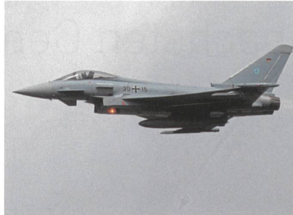
Ein intakter Bundeswehr-Eurofighter.

Die abgestürzten Maschinen gehören zum Taktischen Luftwaffengeschwader 73 «Steinhoff», das in Laage bei Rostock stationiert ist. Der Jet ist 15,9 Meter lang und