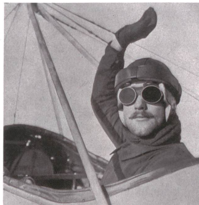
Der Schweizer Flugpionier Bider.

Oskar Bider wurde am 12. Juli 1891 in Langenbruck als Sohn des Tuchhändlers und Landrats Jakob Bider geboren.