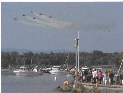
Sechs Tiger über dem Seebecken.