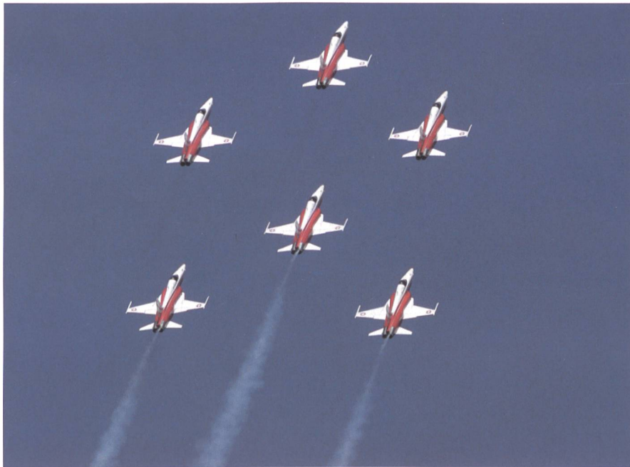
Die Patrouille Suisse am 6. Juli 2019 in perfekter Formation.