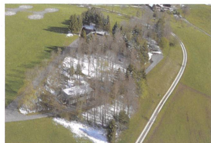
Der Gubel, Ort von BODLUV-Tests.

Acamar wollte seine Dienste auch dem VBS verkaufen, mit Mails, die als aggressiv eingestuft werden. Das langfädige Papier ist mühsam zu lesen; die Lektüre lohnt sich nicht. red.