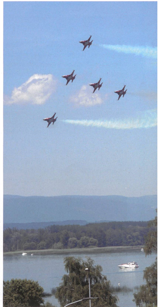
Die PS hoch über dem Murtensee.