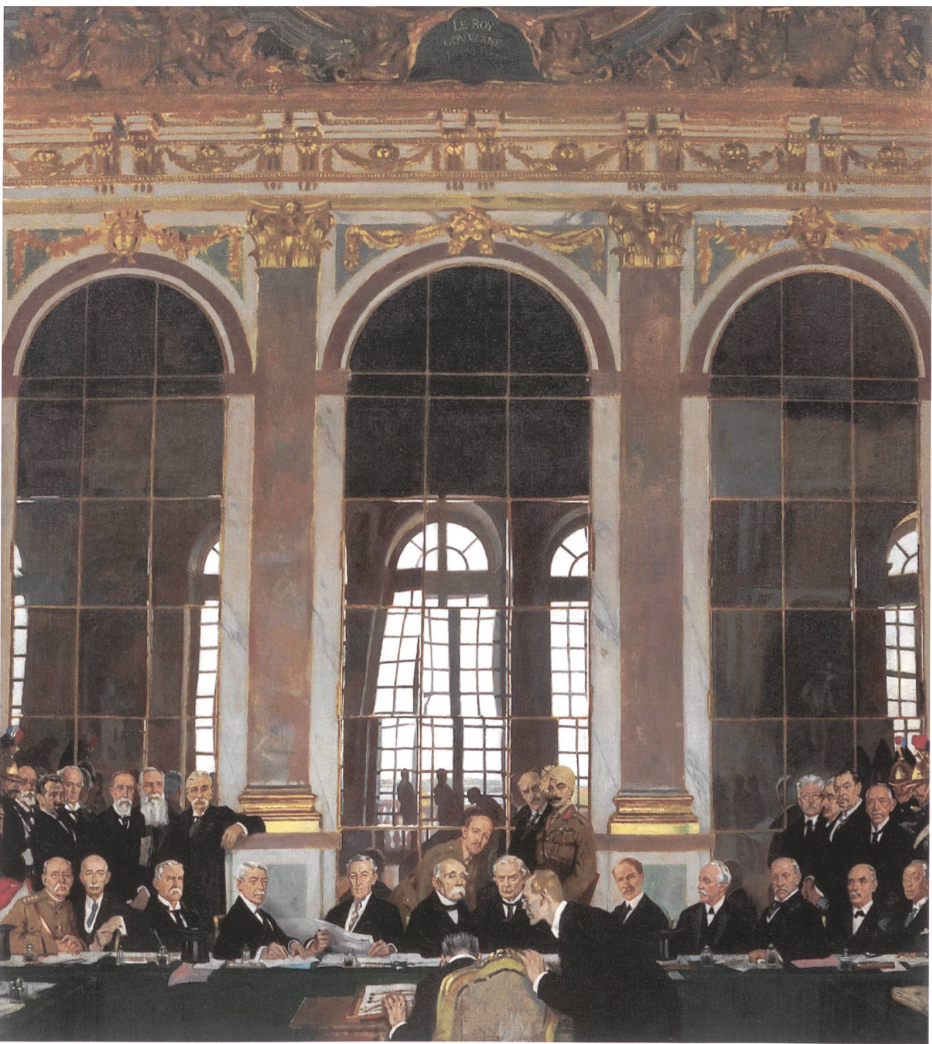
28. Juni 1919, Versailles. Vertragsunterzeichnung im Spiegelsaal, in dem Wilhelm I. 1871 das Kaiserreich ausgerufen hatte. Mitte mit Schnauz Clemenceau zwischen Wilson und Lloyd George. Davor die dt. Minister Bell und Müller. Oben der Spruch, den noch Louis Quatorze, der Sonnenkönig, anbrachte: «Le roi gouverne par lui-même», der König regiert durch sich selbst.