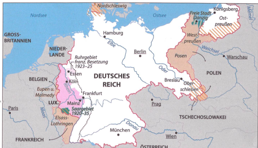
Versailles 1919: Das deutsche Reich verliert 13% Fläche und 10% Bevölkerung.