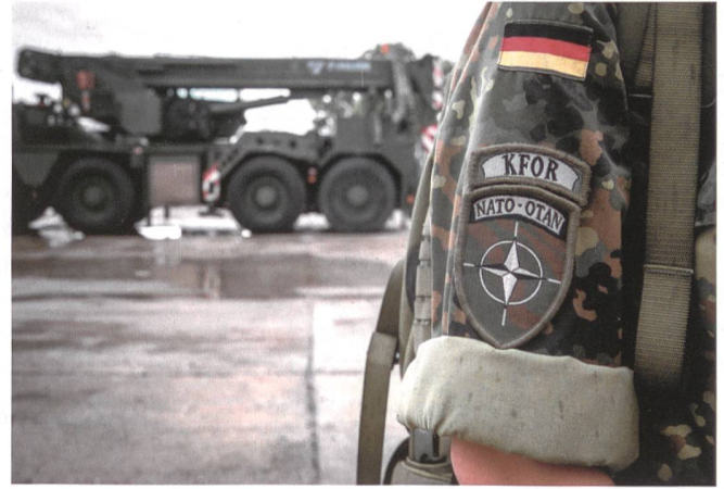
Von Südwesten her stiess die Bundeswehr über Albanien und den Morinapass zu ihrem Ziel vor: zur Stadt Pristina.

schen Kameraden gratulierte, dass der Einmarsch so zügig verlief, gestand der Brite, sein Vorgesetzter habe die Weisung schubladisiert. Der Amerikaner war, wie Jackson schreibt, much amused - sehr amüsiert.