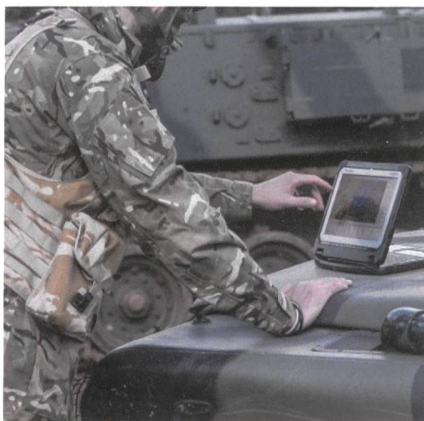
Panasonic: Auftrag von 65 Millionen.

«Als Anbieter von robusten mobilen Endgeräten ist Panasonic seit mehr als 20 Jahren ein zuverlässiger Lieferant von