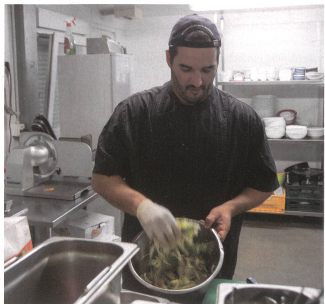
Salat: Die Zubereitung beginnt.