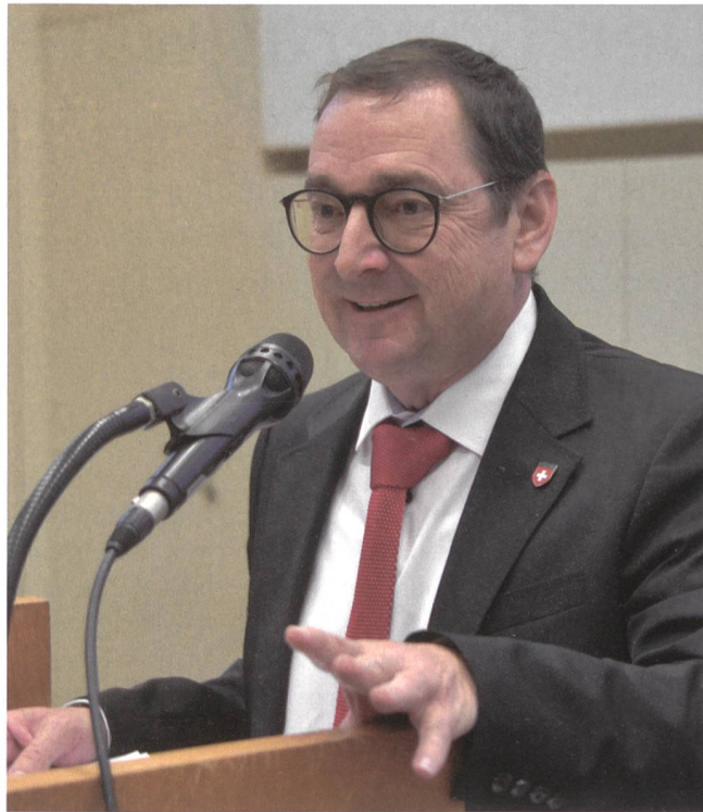
«Gutes muss gesagt sein»: Der neue Präsident hat das Wort.

nanz immer im Griff gehabt habe. «Ich danke ganz herzlich für sein unermüdliches Arbeiten für die Zeitschrift, für die Armee und das Land.»