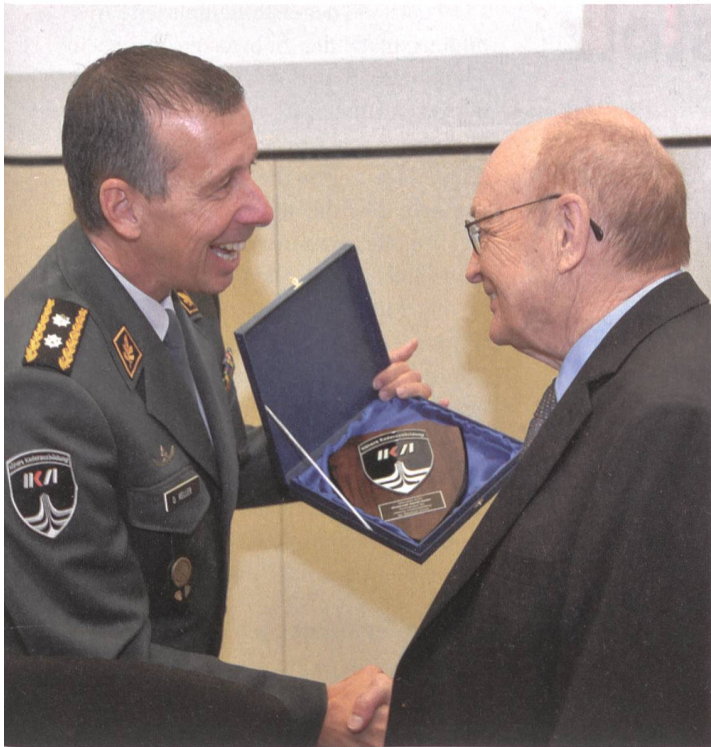
Ehrung durch Divisionär Keller.