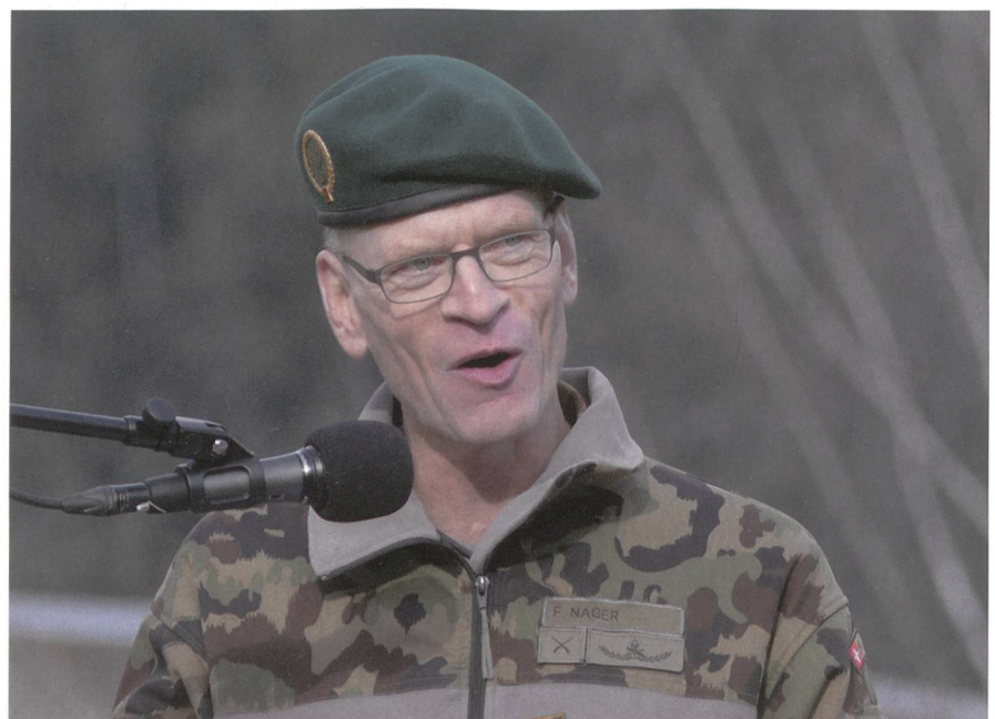
Kommandant des Lvb Infanterie: Brigadier Franz Nager.