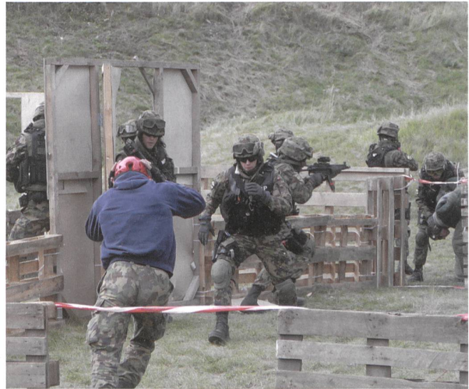
Nahkampf mit blossen Fäusten.