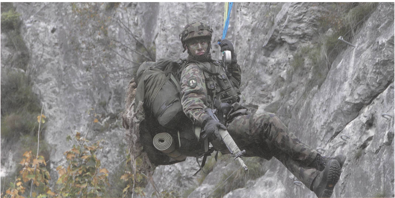
Mit Vollpackung im Gebirge.