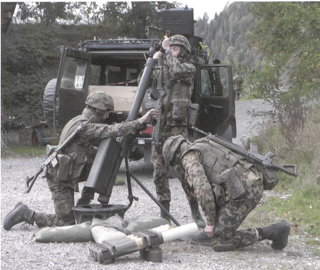
Präzises Feuer durch Minenwerfer.