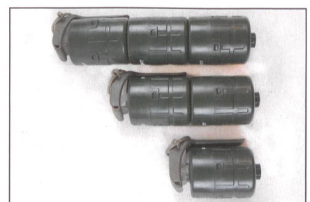
Skalierbare Handgranate MK21 Mod 0.