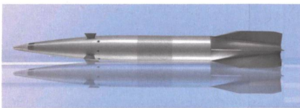
Neue Präzisions-Artilleriemunition VULCANO von Diehl und Leonardo.

Im Auftrag der deutschen und italienischen Regierung haben die Unternehmen Leonardo und Diehl Defence die präzisionsgelenkte Munitionsfamilie Vulcano in den Kalibern 127 mm und 155 mm entwickelt und qualifiziert. Die Vulcano-Munition ist für Reichweiten von 70 km (Vulcano 155) bzw. 80 km (Vulcano 127) ausgelegt und garantiert nach Auskunft der beiden Unter-