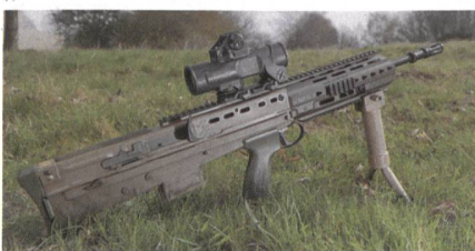
Kampfwertsteigerung des britischen Sturmgewehrs SA80 durch H&K.

Heckler&Koch hat einen Grossauftrag aus Grossbritannien erhalten und modernisiert im Rahmen des Equip to Fight-Programms der britischen Armee das Standardgewehr SA80 zur Version SA80A3. Die Modernisierung umfasst unter anderem einen neuen Sturmgriff, ein verbessertes Gehäuseoberteil, zusätzliche Sicherheitsfunktionen sowie Massnahmen zur Gewichtsreduzierung des Sturmgewehrs. Hierfür legt der nun geschlossene Drei-Jahres-Vertrag mit einem Gesamtvolumen von über 15 Mio. Brit.