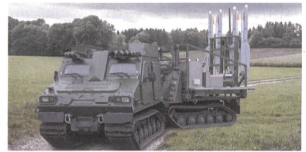
Einsatzbereitschaft des IRIS-T SLS.

Mit der Übergabe der Feueinheiten für die bodengestützten Flugabwehrraketen IRIS-T SLS (Infra Red Imaging System-Thrust Vector-Controlled Surface Launched SHORAD) beginnt in Schweden der Truppeneinsatz des von Diehl gelieferten Luftverteidigungssystems. Eingesetzt vom schwedischen Luftverteidigungsregiment sollen die hochagilen Lenkflugkörper vom Typ IRIS-T Soldaten und Infrastruktur vor Flugkörpern, Angriffen von Flugzeugen und gepanzerten Kampfhubschraubern rund um die Uhr schützen. Schweden ist damit das erste Land, das von der offenen Systemauslegung der neu entwickelten Familie IRIS-T SLM/SLS für die Bodengebundene Luftverteidigung (Ground Based Air Defence, GBAD) profitiert und die für den Einsatzzweck am besten geeigneten Systemelemente (Sensoren/Radare, Führungssys-