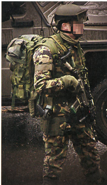
Mit der Pistole wäre ein Zusatzmittel für den Nahkampf verfügbar.