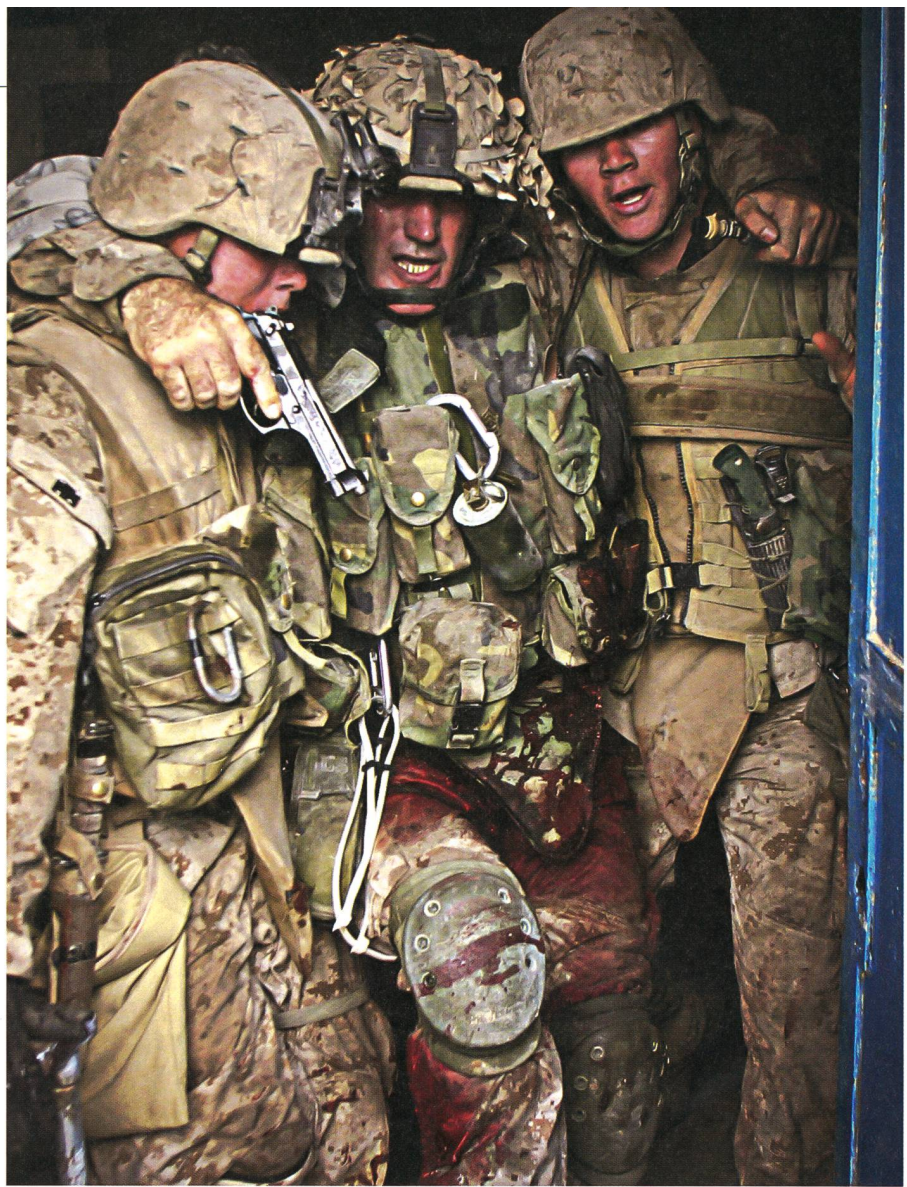
Marine Corps Unteroffizier mit Pistole.