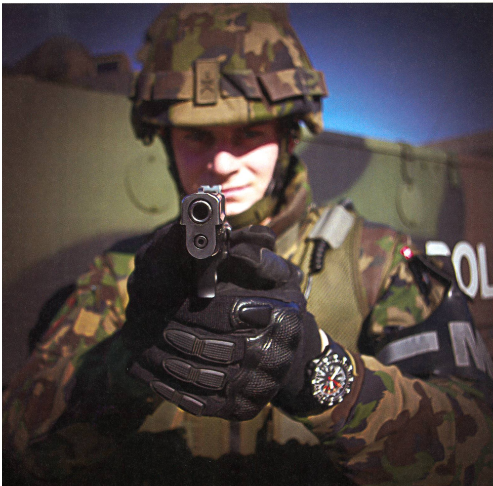
MP-Grenadier mit Pistole 75.

Bedenkt man zudem, dass im Gefecht die Ausführungsverantwortung von den Gruppenführern getragen wird, welche an der vordersten Front kämpfen, wäre es sinnvoll, diese mit einer Pistole auszurüsten. Damit würden sie über ein zusätzliches