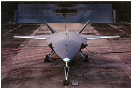
Bodenerprobung von Loyal Wingman.

Der australische Loyal Wingman ist im September mit dem ersten Triebwerkstart in die Bodenerprobung gestartet. Die Bodenerprobung des neuen Luftkämpfers mit dem Namen Loyal Wingman findet bei Boeing Australia statt. Die Drohne wird von Boeing Airpower Teaming System in enger Zusammenarbeit mit der Royal Australian Air Force entwickelt. Australien beteiligt sich auch an den Ent-