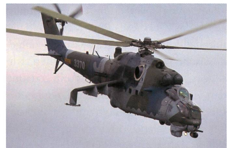
Verbesserter Kampfhelikopter Mil Mi-35P.

Russian Helicopters hat laut eigenen Angaben die Serienproduktion des verbesserten Mi-35P Kampfhelikopters begonnen. Die Mi-35P ist die Exportvariante des Mi-24 «Hind». Der leistungsgesteigerte Mi-35P Kampfhelikopter ist mit einem Beobachtungs- und Zielführungssystem OPS-24N-1L mit Wärmebildsensor, einer Videokamera für Farbbilder und einem neuen Laser-Entfernungsmesser ausgerüstet. Die Piloten können nun auch mit modernsten Nachtsichtbrillen der dritten Generation operieren. Der Mi-35P wurde mit einem modernen digitalen Flugsteuerungssystem ausgerüstet, welches die Piloten bei ihrer Arbeit entlasten soll. Der Waffeneinsatz wird durch ein modifiziertes Feuerleitsystem präziser. Bei dem Mi-35P handelt es sich um einen schweren Kampfhelikopter, der über eine enorme