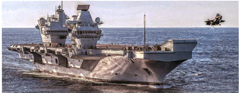
Start einer F-35B von der HMS Queen Elizabeth.

stärken. Laut einer Pressemeldung von Dassault will Griechenland 18 Rafale Kampfflugzeuge beschaffen. Die griechische Luftwaffe ist ein treuer Kunde bei dem französischen Flugzeugbauer Dassault. Bereits im Jahre 1974 hat das Land 40 Mirage F1 gekauft, Mitte der 1980er Jahre folgte eine Bestellung für 40 Mirage 2000 und im Jahr 2000 kamen noch 15 Mirage 2000-5 dazu, diese letzte Bestellung beinhaltet auch die Hochrüstung von zehn Mirage 2000 auf den modernen Mirage 2000-5 Standard. Griechische Zeitungen schreiben, dass die Regierung dahingehend informierte, dass der Auftrag sechs neue Maschinen und zwölf Gebrauchtflugzeuge umfassen soll.