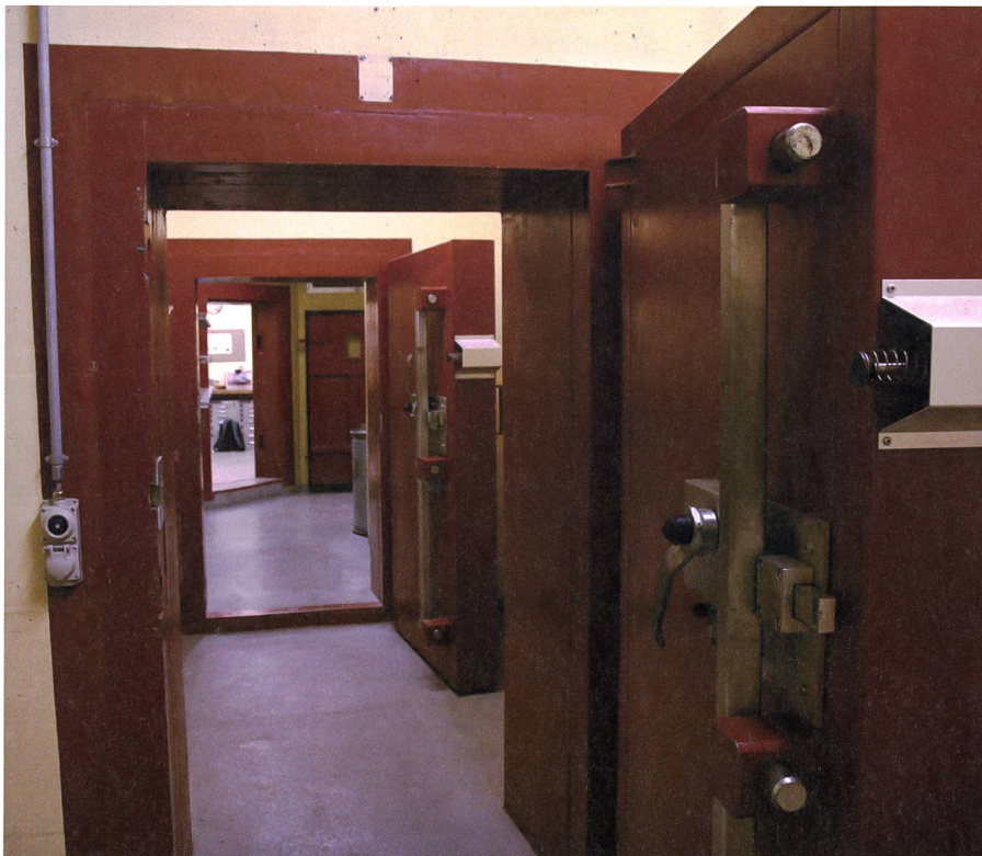
Der Zugang zum Festungsminenwerfer Pila ist hochwertig gesichert: Druckschleuse 3 Atü, Reinigung mit Warmwasserduschen, Gasschleuse mit Schleusenwart.

In den 1960er-Jahre wurden zuerst zwei Versuchswerfer Typ A gebaut, davon einer am Lukmanier. Ende der 60er-Jahre wurden 10 Werfer Typ B erstellt, welche zu einem späteren Zeitpunkt mit ASU-Unterständen erweitert worden sind. 1970 kamen drei zweigeschossige Monoblocks hinzu. Ab 1976 bis 1987 wurden 19 Monoblocks mit grosser Infrastruktur erstellt, darunter auch die Anlage A7698, Pila. Ab 1987 bis 1994 wurden 18 eingeschossige