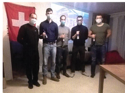
Screenshot einiger Kameraden aus dem Home Office.