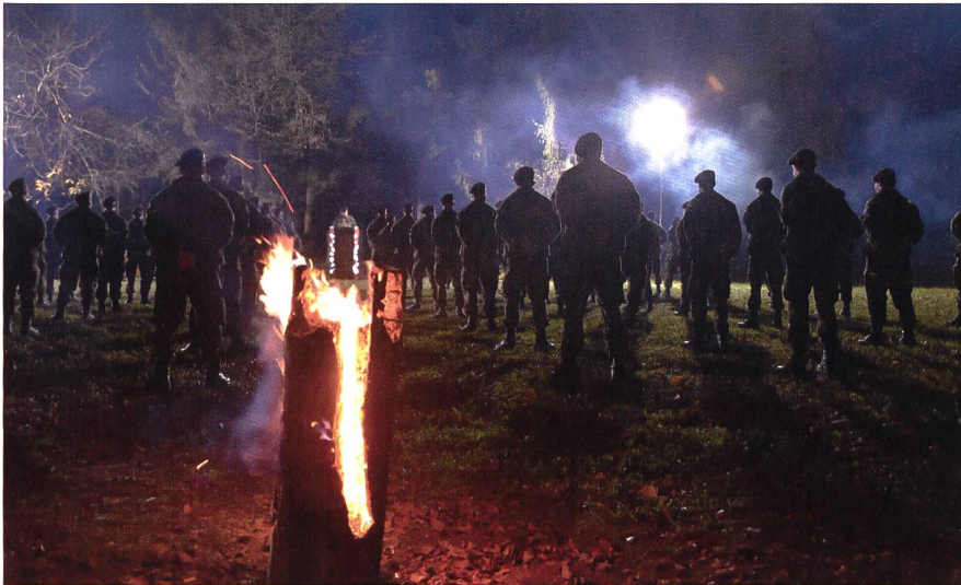
Traditionsbewusst und wertschätzend: Beförderungszeremonie der Genie-UOS.

Die Die Beförderungsfeier der Genieunteroffiziersschule konnte unter Scheinwerferlicht und bei warmem Feuer abgehalten werden.