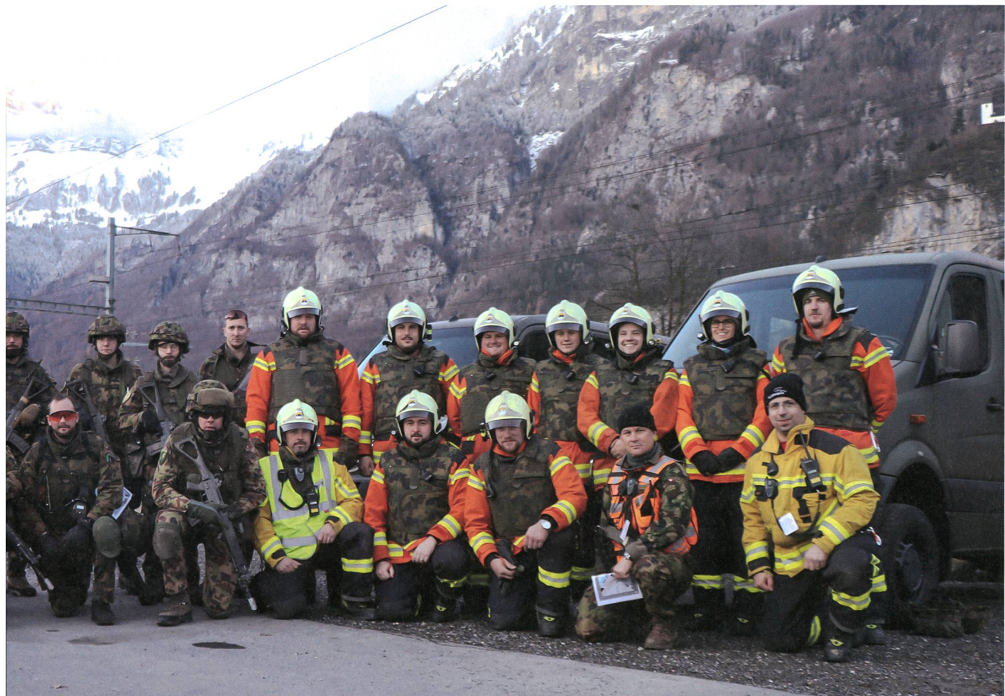
sammen mit der Feuerwehr Flums.

klar. In der heutigen Welt der hybriden Bedrohungen, muss sich die Armee vielfältigen Herausforderungen entgegenstellen. Was jedoch eindeutig ist: Im AZA wird realitätsnah, kompetent und zukunftsorientiert ausgebildet. +