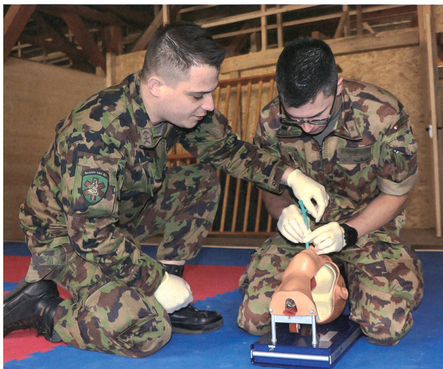
Vorzeigen – Vorbild sein: Die Profis zeigen den Teilnehmern was zu tun ist.

Im Briefing zur Einsatzübung wurde das erwartete Szenario erneut beschrieben. Eine bewaffnete Gruppierung die FEP (Front of Elbonian Power) betreibt ein verdecktes Feldlazarett in einem alten Hotel. Anwohner berichten von blutigen Bettlaken im Abfall und nächtlichen Personentransporten. Mehrere bewaffnete Personen scheinen das Gebäude zu bewachen. Aufgrund der fiktiven Sicherheitslage bittet die zuständige Behörde die Armee um Unterstützung. Doch ganz allein kann es die Truppe nicht meistern. Denn das Gebäude ist besonders brandanfällig. Was, wenn die Gegenseite Molotov-Cocktails einsetzt? Der Fall ist klar: Die Feuerwehr muss auch an Bord sein. Doch, wie funktioniert die Zusammenarbeit mit einer Mi-