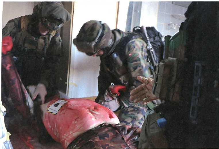
Jede Sekunde zählt: Die Blutung muss schnellsten gestoppt werden.

Die Spezialisten des Ausbildungszentrums der Armee sind nun am Zug. Sie geben detailliertes Feedback auf Stufe Sanität und natürlich bezüglich des Häuser und Ortskampfes. Ein ereignisreicher Tag neigt sich seinem Ende zu. Das Zusammenspiel der Partnerorganisationen und