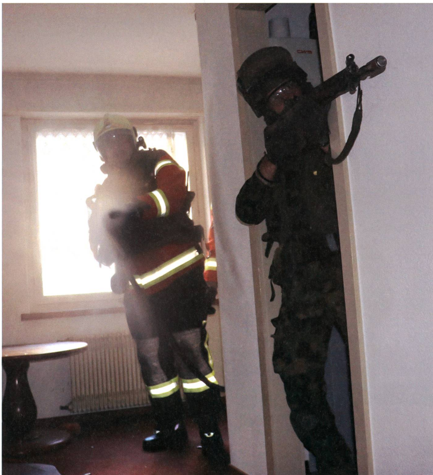
Wasser marsch! Die Infanterie deckt den Löschtrupp der Feuerwehr ab.

Dank dem professionellen Vorgehen der Truppe, können die Angehörigen der Feuerwehr das Gebäude, trotz Präsenz