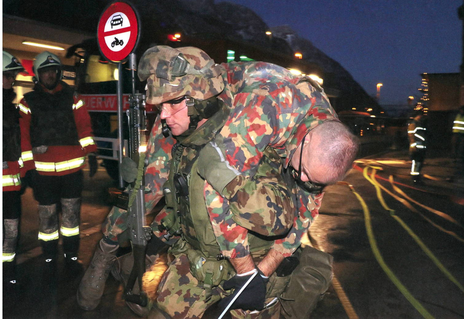
Starke Leistung: Ein Teilnehmer evakuiert einen verletzten Gegner.